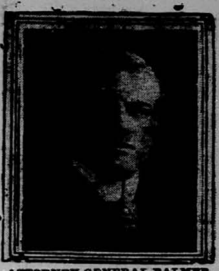
ATTORNEY GENERAL PALMER

"Za trideset izgledaš, za trideset. Le kar korajžo, pa poprshal! Vem, da ne bodo rekli ne."