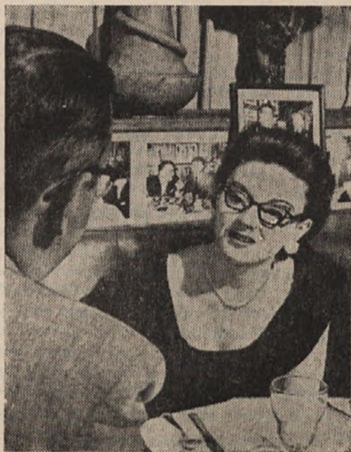
Za ljudi, ki slabo slišijo in uporabljajo ojačevalce, je neka ameriška firma izdelala očala, ki imajo baterijo vdelano v okviru. Od očal vodi tanka vrstica do ušca, kar je edini vidni del te naprave. Za ljudi, ki ne nosijo očal, izdelajo očala z navadnimi stekli. (AND/UP)

Izbiranje ali selekcija pa ni dolžnost le semenarju in večjih pridelovalcev dobrega semena, temveč vsakega kmeta. Tudi v majhnem je treba sejati dobro seme, da iz dobro obdelane zemlje dobimo čim večji in čim boljši pridelek.