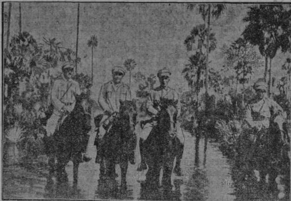
Iz vojne med Paragvajem in Bolivijo. Bolivijski konjeniki na poizvedovanju.

V kotu vele mesta, pred stebrom za lepljenje plakatov, se je zbrala ljudska množica. Naenkrat udarijo ljudem na ušesa iz notrajnosti stebra slabejši kliki: na pomoč! Zbrani poslušajo vsi preplašeni, nekateri prislanjajo celo ušesa na steber. Čisto razločno čujejo: »Na pomoč, hitro, sicer se bom zadušil, zaprt sem v stebru.« Takoj pokličejo na odpomoč gasilce. Ljudje na cesti so v nepopisnem vznemirjenju ter se nekoliko oddahnejo, ko začnejo gasilci razdirati plakatni steber. Po nekaj minutah najhitrejšega in kar najbolj naporenega dela je steber narazen. Žive duše niso rešili iz notrajnosti, le transformatorji mestnega električnega