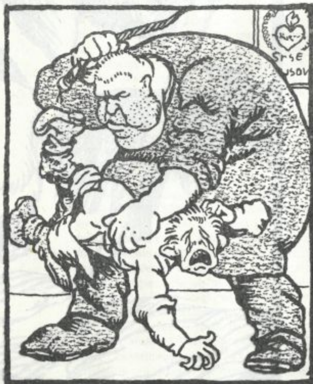
Prizor iz zlate dobe za dr. Šusteršičevega vladanja.