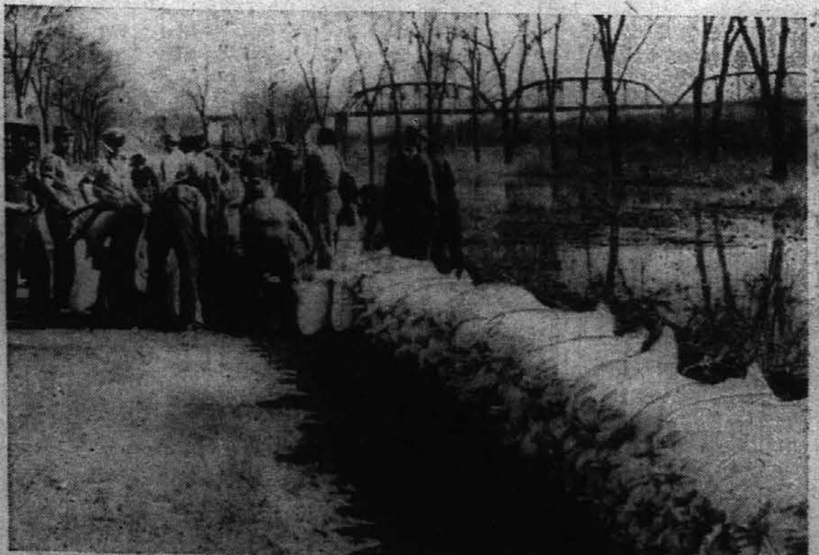
Pri Council Bluffs, Iowa, je že dni gornila povodanj radi naraščajoče reke Missouri. Nižninske kraje so obvarovali povodnje, tem, da so napravili kot ograjo iz vrel naplavljenih s peskom.

kaj je na vesteh resnice. Takoj po zamišljenem nemškem načrtu) v svet, mu je že sledila sugestija, naj poljska vlada v Londonu zaprosi za mednarodno komisijo rdečega križa, ki naj gre in ugotovi kaj je na vesteh resnice. Taka komisija je baje šla na delo in res grobove videla. Kedar so bili pobiti poljski častniki, to pa ni točno ugotovljeno. Prav lahko je, da so jih Nemci sami pobili. Potem pa vso stvar umetno naredili tako, da obdolžitev za zločin pada na Ruse. Ruska vlada tudi tako trdi in zanika vsako obdolžitev in krivdo. Nemci so satansko prekanjeni in s takimi pretvezami znajo netiti so- raštvo med slovanskimi na-