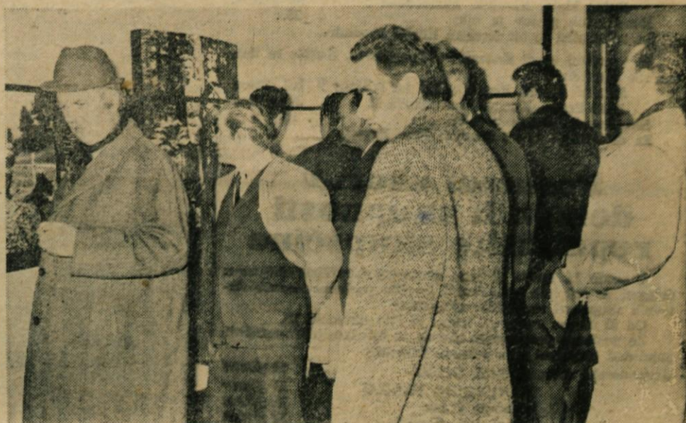
V počastitev 50-letnice KPJ, Skoja in sindikatov so preteklo sredo v kamniškem muzeju odprli stalno razstavo NOB na Kamniškem