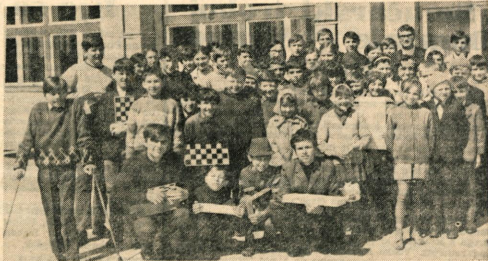
Udeleženci pionirskega šahovskega tekmovanja v Kamniku