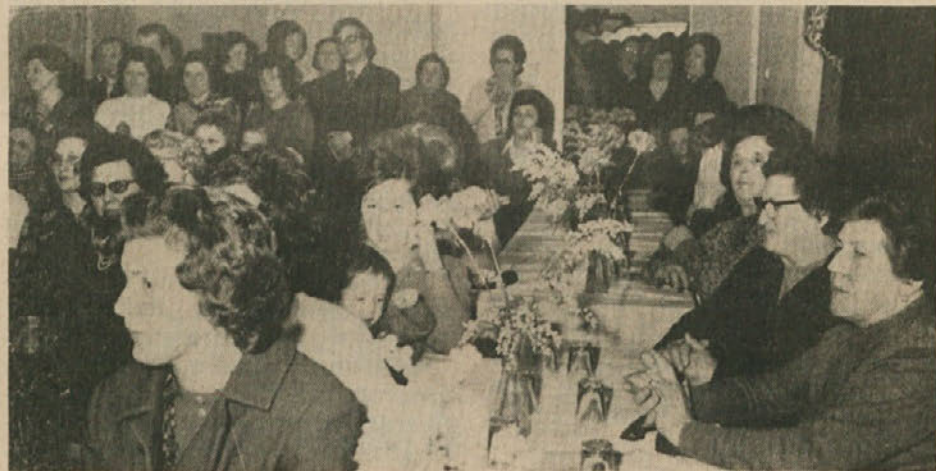
Naše žene so proslavile svoj praznik — 8. marec. V številnih krajih so bile kulturne prireditve. (Gornja slika je bila posneta v Dolini).

Odgovor: V Trstu povečini so glasno, nato pa ženske, ki so hotele urediti svoj položaj matere in zakonske družine.