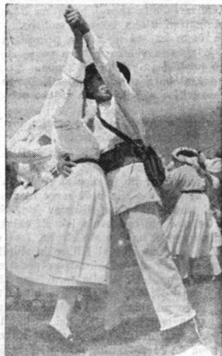
Viniško kolo, prizor z nedavnih festivalskih slavnosti v Mariboru.

O slavnosti sami smo izčrpno poročali že v zadnji številki. Tale odlomek iz govora pa na nam priča, da je naša kmetska mladina na pravi poti in se z vso resnostjo in iskreno ognjevitostjo pripravlja na prevzem in izvršitev naloga, ki jo čakajo.