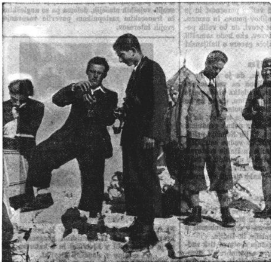
Nj. Vel. kralj Peter II. na Triglavu