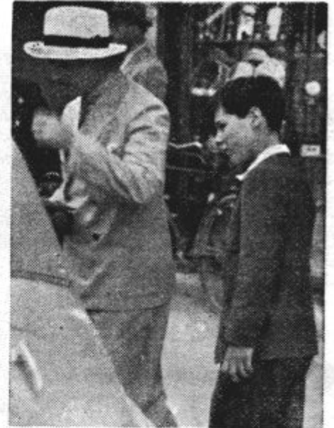
Nj. Vis. kraljevič Tomislav je prevzel pokroviteljstvo nad II. gasilskim kongresom, ki se je te dni vršil v Ljubljani in o katerem poročamo v današnji številki.

Druge manjše države, ki so bile povabljene k tem pogajanjem, se jih udeležujejo deloma po svojih vojaških atašejih, deloma pa so angleškimi in francoskim zastopnikom poverile varovanje svojih interesov.