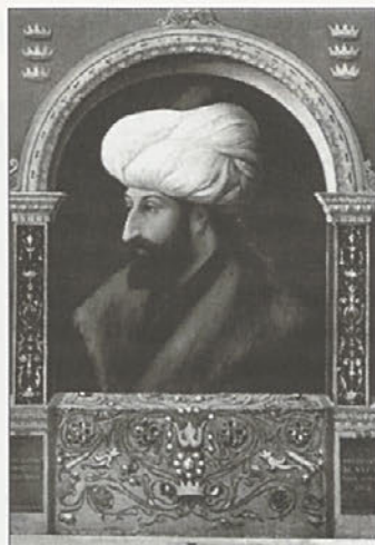
Portret sultana Mehmed II. (1432–1481).

osvojila Trakijo in južno Bolgarijo, 1371 je v bitki pri Marici in nato še 1389 na Kosovem polju porazila Srbe, 1393 dokončno zasede bolgarsko cesarstvo, 1394 zavzame Tesalijo ... Leta 1396 je proti Osmanom madžarski kralj Sigismund organiziral križarsko vojsko. V bitki pri Nikopolju v Bolgariji je vojska, sestavljena iz vitezov celotne Evrope, doživela popoln poraz.