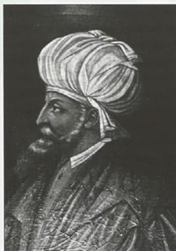
Manj bojeviti sultan Bajazit II.