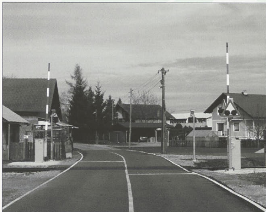
Prehod v Njivercah

predsednik komisije za spremljanje in reševanje ureditve železniških prehodov v občini Kidričevo