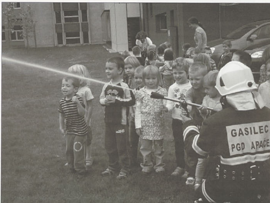
Tako so otroci s svojimi vzgojiteljicami počakali na igrišču gasilce.