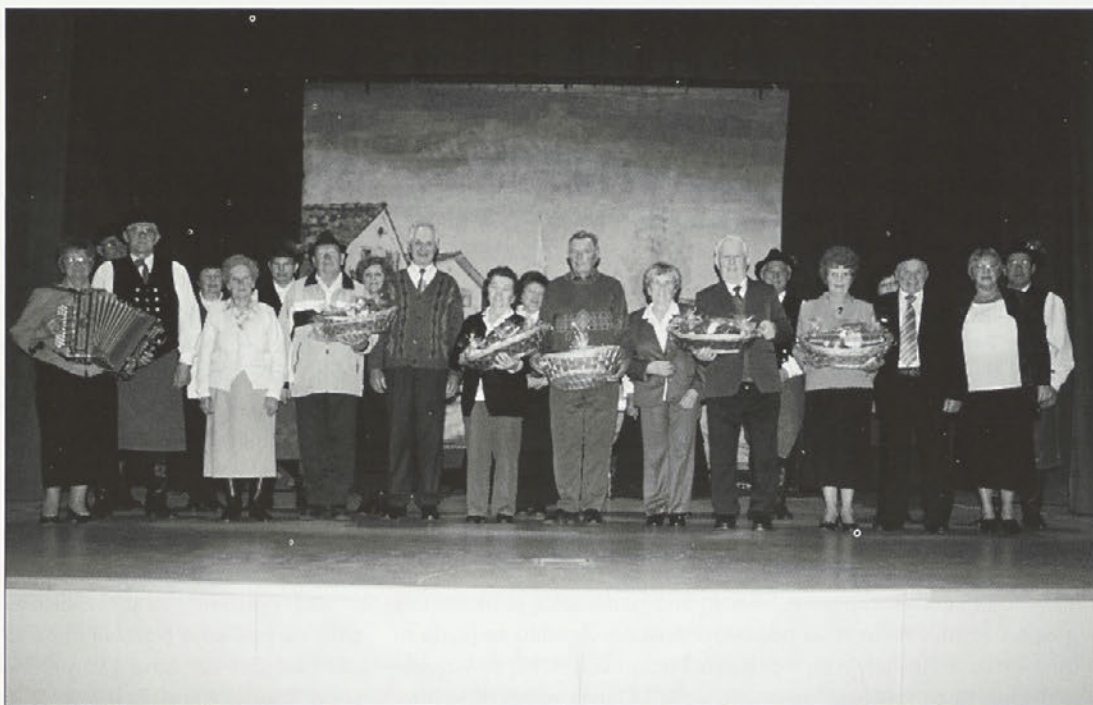
Veterani folkloristi in zlatoporočenci