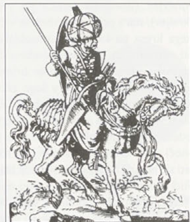
Podoba osmanskega kanjenika spahije.

Dolžnost islamizacije je Osman, kateremu so vojaški pohodi predstavljali glaven vir dohodkov, kaj hitro izkoristil, tako da je vsak svoj spopad razglasil za versko, sveto vojno (džihad) in do konca življenja na tak način pridobil ozemlje, veliko 18.000 kvadratnih kilometrov. S podobno politiko ekspanzije je nadaljeval njegov sin Orhan, ki je spretno izrabljal notranje razprtije močnega sosedu Bizanca. Leta 1349 je priskočil na pomoč bizantinskemu bazileju (vladarju), ki ga je pri Solunu ogrožal srbski car Dušan. S tem je osmanska vojska, čeprav le za kratek čas, prvič globoko prodrla v Evropo. S pravimi osvajaškimi pohodi po Evropi je pričel Murat I. Med leti 1363 in 1365 je osmanska vojska