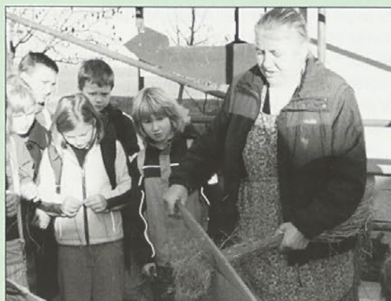
Na obisku v Sestržah