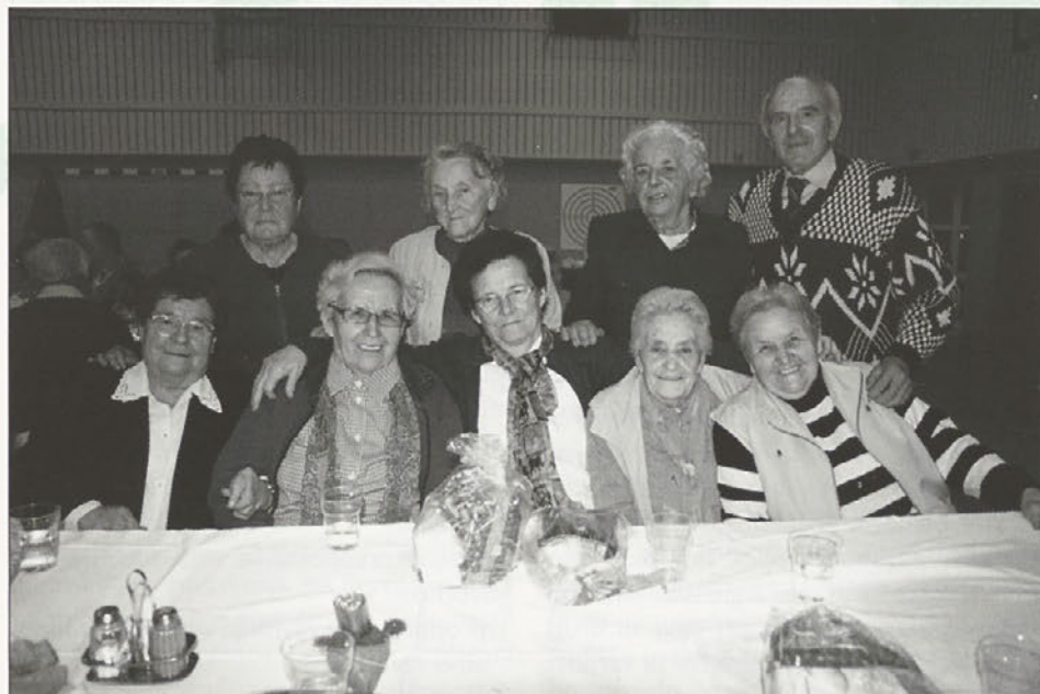
Spominski posnetek sovasčanov