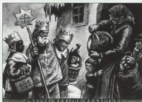
Krajnski koledniki s stavnic – nekatere so bile tako debele, da sta jih dva moža komaj zaobjela. V: J.V. Valvasor, Slava vojvodine Krajnske, 1689, III/7, str. 472–473.

praznične mize), četrti pa zahvala ter poslovilne besede. Po končanem obhodu so se koledniki zbrali v eni od vaških hiš in skupaj pojedli nabrane dobrote. Tu in tam je cerkev koledovanje porabila za lastne potrebe, zlasti za cerkveno svečavo. Koledniki so po vaseh in gradovih zbirali denar za nakup voska, iz katerega so pozneje naredili tanke svečice. Te so spletli po tri drugo v drugo in jih razobesili na posebno stojalo, imenovano »stavnic«. Ker so se skupine kolednikov nemalokdaj med seboj steple, je cerkev to šego v začetku 19. stoletja prepovedala. Med koledniškimi pesmimi so se v zimskem