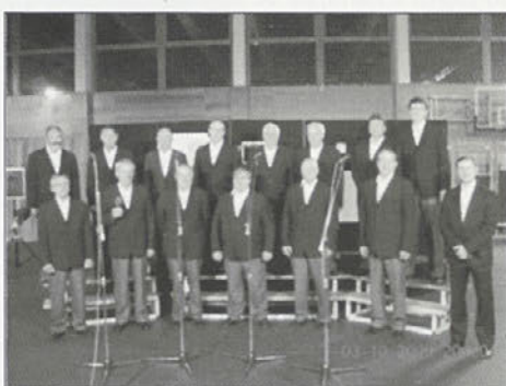
Nastop v Pesnici.