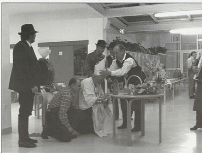
Jesensko srečanje obrtnikov in podjetnikov naše občine

Ob odhajajočem letu pa člani Odbora za gospodarstvo Občine Kidričevo želimo