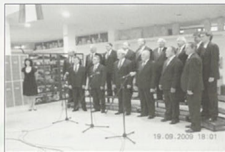
Utrinek z nastopa v Radljah ob Dravi.

To so utrinki iz našega dosedanjega dela, nadaljevali pa bomo po našem programu dela. Vseh teh trenutkov bi ne bilo brez vseh nas, zborovodja in pevcev, in seveda naših donatorjev, katerim smo iz srca hvaležni. Kot vidimo, so naše vrste zapolnjene z izkušenimi pevci, manjkajo nam pa mladi, kateri bi nadaljevali tradicijo tega zbora. Zato ob tej priložnosti vabim fante in moške z voljo in poslušom nadaljevati naše delo, da se nam pridružijo. Kontakt na mob. tel. 051 609 819. Vabljeni!