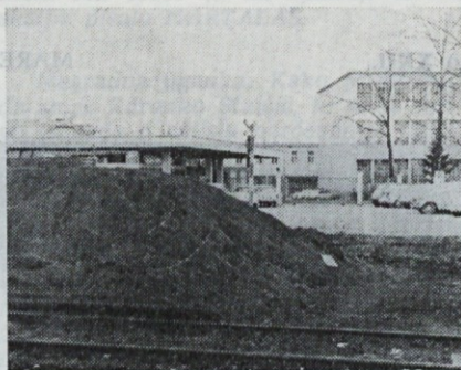
Neurejena deponija premoga

Našo prodajno politiko smo oblikovali v skladu s poslovnimi odločitvami, sprejetimi na osnovi našega že nekajletnega stabilizacijskega programa.