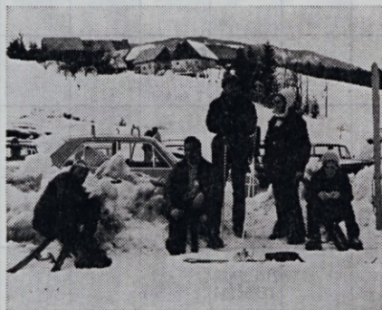
Del naše ekipe