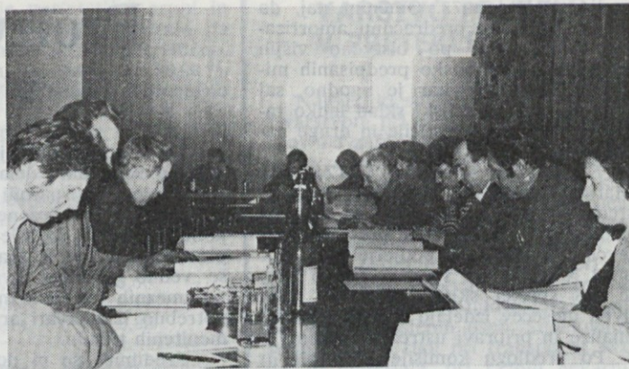
Člani DS med obravnavanjem poslovnega poročila

Pri celotni proizvodnji je bilo doseženo 6% znižanje variabilnih stroškov in 10% znižanje izdelavnih ur;