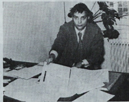
Terjatve, terjatve, terjatve...

Za znižanje terjatev skrbi posebna komisija, ki jo sestavljajo tov. direktor, šef komercialnega sektorja, šef računovodstva in vodja prodaje na domačem trgu. Komisija je svojo nalogo dobro opravila, tako da so se ob koncu leta terjatve znižale celo za 13 % pod normativno vrednost.