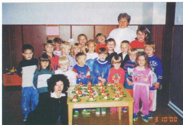
Egęszsęgesen táplálkozunk - Zdravo jemo

keretében próbáljuk a gyerekeket megismertetni és rászoktatni a helyes és egęszsęges étkezésre, különösen a zöldsęgek és gyümölcsök fontosságára és a tisztaság fontosságára helyezük a hangsúlyt.