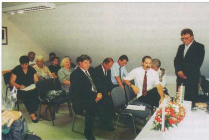
Svečana seja ob prvem občinskem prazniku - Az első községi ünnep ünnepi ülése

Odkipili smo gradbeno parcelo, za morebitno gradnjo stanovanj.