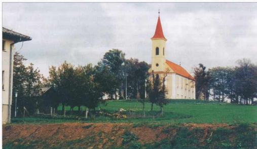
Cerkev na Hodošu - A hodosi templom

Poleg obnove cerkve, je bilo delno pripravljeno novo, večnamensko igrišče ob župnišču. V zgradbi župnišča, ki služi tudi kot Mladinski dom Evangelíčanske Cerkve v Sloveniji, so bile urejene štiri nove tuš-kabine in dvoje sanitarij na podstrešju.