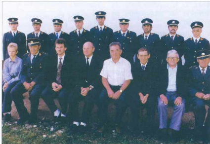
Ob 70. obletnici PGD Krplivnik - A kapornaki ŐTE 70. évfordulója

A lelkes gyakorlatozásnak a nyár folyamán született még egy eredménye.