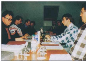
Seja občinskega sveta - A községi tanács ülése

Vzdrževali in urejali pokopališča ter gozdne ceste.