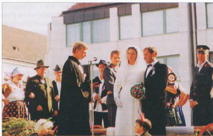
Régiók találkozója Budapesten - Srečanje regij v Budimpešti