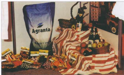
Razstava EXPO v Budimpešti - A budapesti EXPO - ról

Rezultati in dosežki v podjetju so posledica prizadevanj in delovanja vseh zaposlenih, še posebej pa naše skupne odloènosti, da zastavljene cilje ne le dosegamo, ampak celo presegamo, zato smo lahko na naše delo in rezultate v letu 2000 upravièeno ponosni, saj smo načrte za to leto več kot presegli.