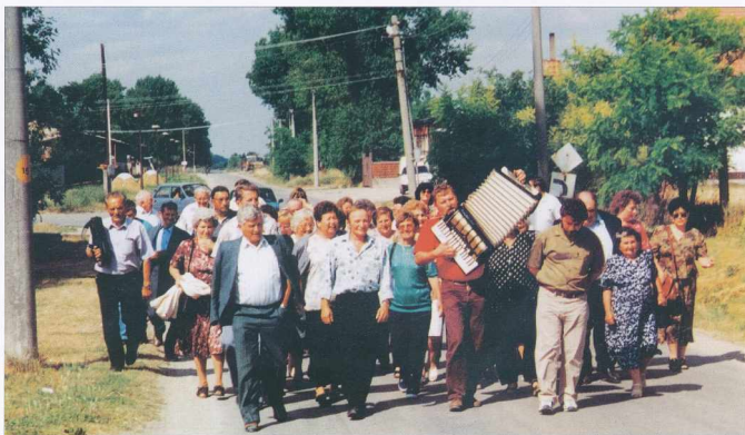
Izlet upokojencev na Slovaško - A nyugdíjasok kirándulása Szlovákiába