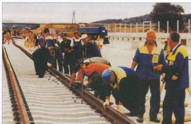
Polaganje tirov - Sinek lerakása

Predor je dolg 320 metrov z objestransko galerijo in skupni dolžini 305 metrov.