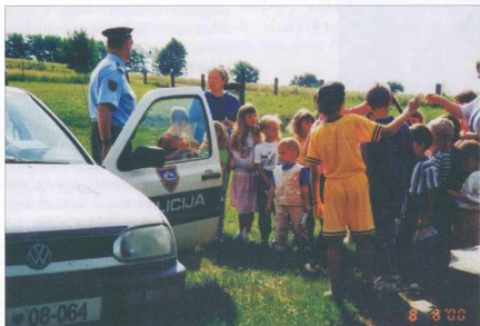
A rendõrök is meglátogatták iskolánkat és óvodánkat Obisk policije v vrtcu in šoli

A közlekedés terén a GYEREKEK A KÖZLEKEDÉSBE-cím alatt konkrét információkat, fontos tudnivalókat szereztek a rendõrbácsitól, aki a rendõrkocsi mellett az udvaron ottatta a gyerekeket.