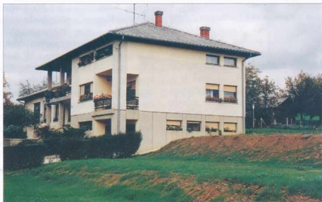
Mladinski dom - Az ifjúsági otthon