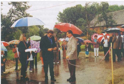
Orvoritev cest - Űtmeġnyítű

Ebből is kitűnik, hogy az önállósulásunk utáni első évben sok kiadásunk volt, bár ennek nincs meg mindig a