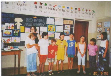
Iskolánk tanulói - Naši šolarji

egyszer van mûsoron. Közreműködésükért már sok ajándékot kaptak (mesékönyveket, festéket, CD-lemezt, dominókat, tollas labdát). Munkánkba bevonjuk a környékünkben élõ szakembereket is, akik foglalkozásaikkal, tanácsaikkal ismertetnek bennünket. Ezeket projekt munka formájában szokjuk végrehajtani. A 2000-es évben a következõ projekt munkákat végeztük el: A tüzvédelem elleni hõtbent-TÚZOLTÓK AZ ÓVODÁBAN ÉS ISKOLÁBAN-a tízoltók életével,