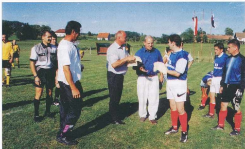
Srečanje med člani NK Gleisdorf in NK Hodoš Gleidorf-i LK és a hodosi LK közötti találkozó