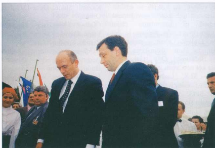
Polaganje temeljnega kamna železniške proge - A vasút alapkövetétele

Uredili okolico muzeja in postavili letni oder.