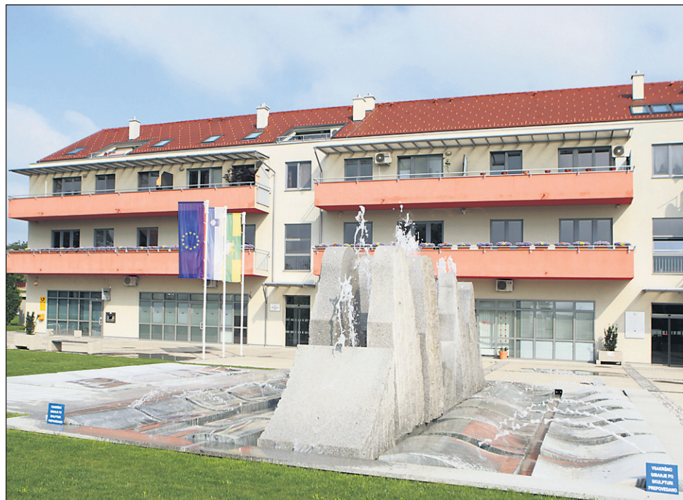
V občini Hajdina še vedno nimajo podatkov o tem, kako uspešni so bili na natečaju za pridobitev sredstev za razvoj vaških središč, na katerem so kandidirali s sedmimi projekti.

Na zadnji seji sveta občine v aprilu – maja se svet ni sestel – so sprejeli tudi oba odloka, ki se nanašata na opravljanje