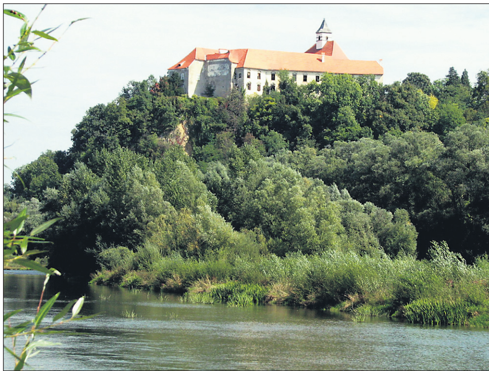
Za grad Borl naj bi bila junija v Uradnem listu objavljena prva dražba; izklicna cena naj bi znašala 2,3 milijona evrov, vendar je vprašanje, ali bo za propadajoč grajski kompleks kljub relativno nizki ceni sploh kdo pokazal zanimanje, saj je glede na predvideno in zahtevano namembnost (hotel višje kategorije) vanj treba vložiti še vsaj desetkrat toliko milijonov evrov ...

Iz odgovorov je jasno, da pristojni na MIZKŠ ne razumejo zahteve DgB ali pa ne poznajo zgradbe borlskega gradu. Zahteva za odprtje prvega dvorišča z grajsko kapelo namreč nima ničesar skupnega z naštevanjem (sicer res) nevarnih in številnih poškodb v ostalih grajskih prostorih. Prvo dvorišče s kapelo je namreč čisto lahko popolnoma ločiti od drugih prostorov in dvorišč, saj je treba le zakleniti vmesna dvoriščna in notranja vrata. V praznem bazenu na travniku pred gradom pa se danes prav