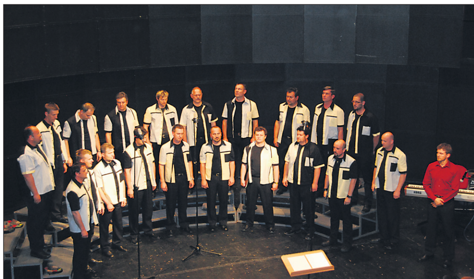
Komorni moški zbor bo svoj tokratni letni koncert izpeljal v slavnostni dvorani ptujkega gradu.