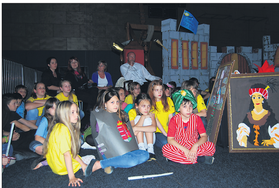
Pri kreiranju projekta so sodelovale vse ptujске osnovne šole.

V kreiranju te - ki govori o vseh nas - so sodelovale vse osnovne šole v Mestni občini Ptuj, svoje ideje pa so prvič v tako velikem obsegu združile pod eno streho. Kot je de-