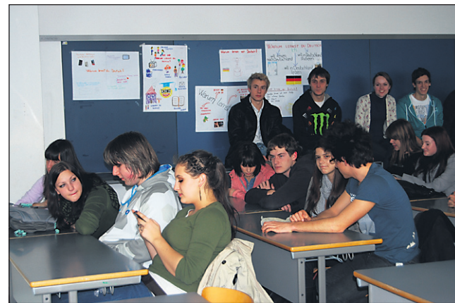
Maturantje po vsej državi te dni pišejo maturo. (Fotografija je simbolična.)