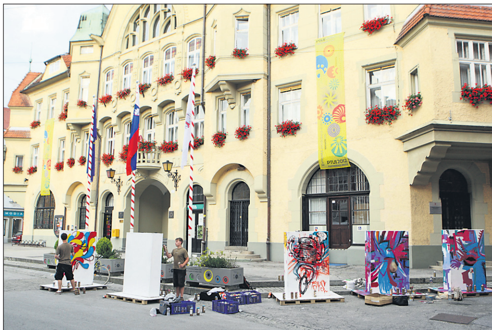
MO Ptuj je med prvimi sedmimi slovenskimi občinami, ki so prejele certifikat Mladim prijazna občina.

MO Ptuj se je na javni poziv za pridobitev certifikata Mladim prijazna občina, v okviru katerega se je izkazala, da uspešno izvaja ukrepe s področja vertikalnih in horizontalnih politik, med drugim odzvala tudi na pobudo svetnika Mirana Meška (SD).