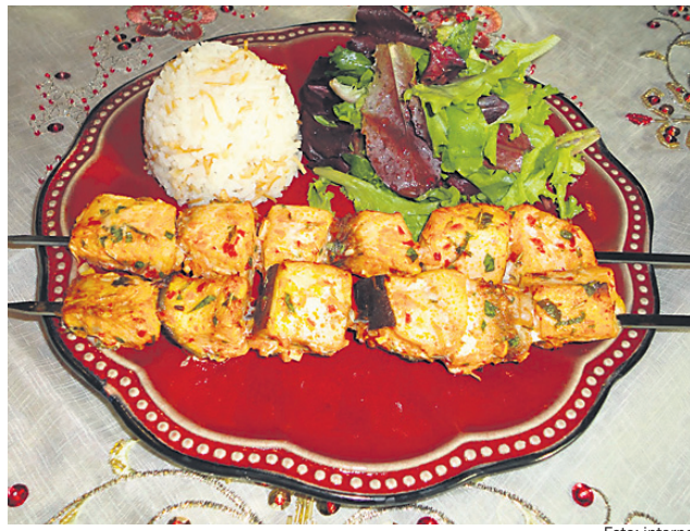
Ražnjiči iz mečarice

Okus mesa mečarice najbolj zaznamo, če jo začinimo s soljo in poprom ter spečemo fileje na olivnem olju, skupaj s prej omenjenimi zelišči na žaru ali