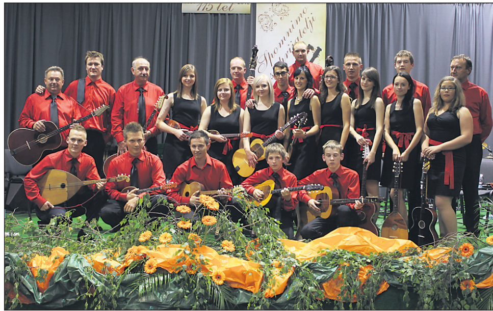
Gorišniški tamburaški orkester (na posnetku) je na petkovem dobrodelnem koncertu skupaj z gosti navdušil tisočglavo množico obiskovalcev.

zbrali prek 30, zato računam, da bo bilanca koncerta pozitivna in da se je zbralo vsaj 1000