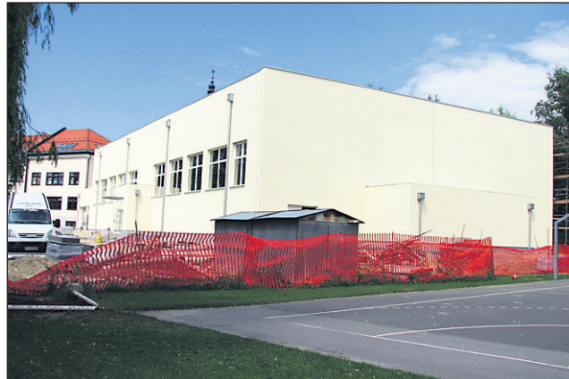
Finančno najzahtevnejša naložba tekočega leta v Cirkulanah je izgradnja velike večnamenske dvorane (na posnetku), ki bo dokončana to poletje.