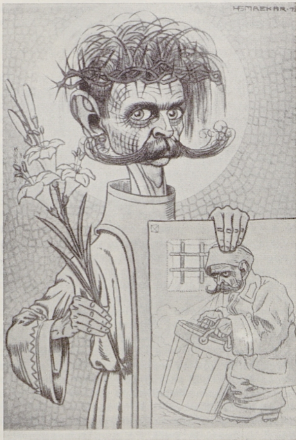
Hinko Smrekar: Ivan Cankar, mučenec (kolorirana risba iz l. 1913)

Slovinci smo imeli že pred tem svojo gledališko umetnost, ki je dala takšnega mojstra-režiserja, igralca in pomembnega gledališkega pedagoga, kakor je bil Ignacij Borštnik, ki je delal v slovenskem in hrvaškem gledališču in takšno nadpovprečno gledališko umetnico, kakor je bila Vela Nigrinova, ki je po svoji preselitvi v Beograd postala prvakinja Narodnega pozorišta, kakor je Davorin Jenko utemeljitelj srbske umetne glasbe. Leta 1879 — drugo leto mine že devetdeset let — je celo postal Davorin Jenko ravnatelj srbskega Narodnega pozorišta v Beogradu, v katerem je kot kapelnik in komponist delal celih 32 let ter komponiral med drugim tudi pesem »Sto čutiš, Srbije tužni« in nekdanjo državno himno, kakor je ustvaril Slovincem nekoč popularno in programatično spodbudnico »Naprej zastava slave«.