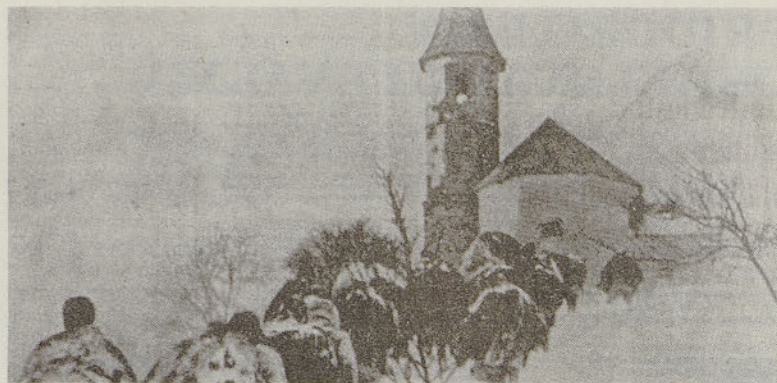
Na pohodu XIV. divizije

Bilo mu je nekoliko nerodno, ker je moral uporabiti take besede. Besedo partizan je imel za psovko, čeprav je čutil, da so »banditi« edini ljudje, ki se borijo zanj, za njegovo zemljo, ženo in otroke.