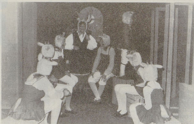
Volk in sedem kozličev, igrca za najmlajše

V času, ko je nastajala predstava za naše malčke, tista vsem dobro poznana pravljica o volku in sedmih kozličkih, smo se prepričali, da so otroci ne le hvaležna publika, temveč imajo tudi neverjetno veliko čuta odgovornosti. Kolikokrat je bilo treba priti popoldan na vaje, ko bi se bilo vendarle lepše u naj igrati, kakor to počne večina drugih otrok. A so se temu odpovedali.