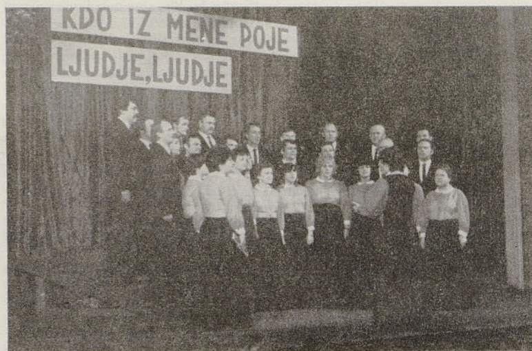
Pevski zbor Železar na srečanju pevskih zborov na Jesenicah