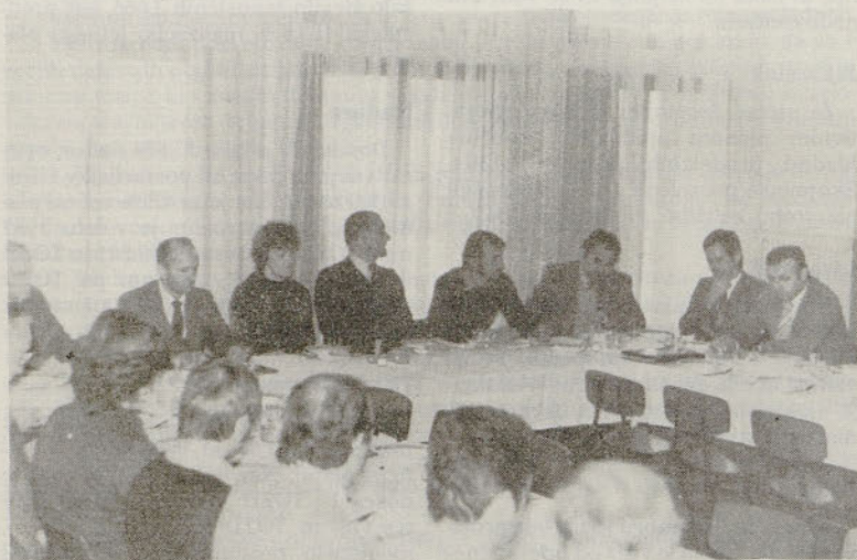
Udeleženci razgovora IZLETNIK Celje – ŽELEZARNA Štore