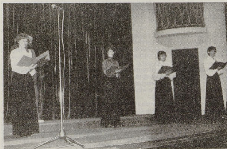
Recitatorska skupina AG Železar (arh. AG)