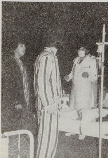
S predstave »Ni človek, kdor ne umre«