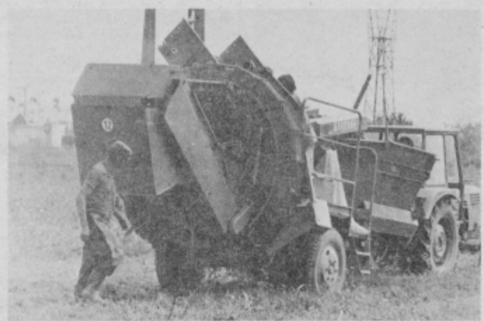
Izkop krompirja na Dravskem polju danes opravljajo pretežno s kombajni.

oblikovana krompirjeva proizvodna skupnost, v kateri se pridelovalci dogovarjajo o ceni in