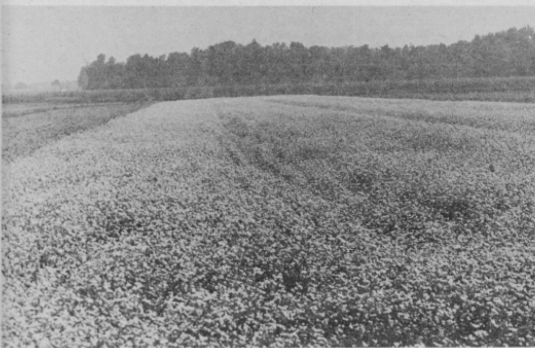
Ena od vse redkejših ajdovih njiv na Dravskem polju.

kulture že opustili, tako da jo pridelujejo le še redki kmetje. Ocenjujejo, da je letos na območju ptujске občine posejanih z ajdo le še okrog 120 hektarjev, kar precej manj, kot nekaj let poprej. Tako kaže, da bodo njive z ajdovim cvetjem, kot prikazuje fotografija, postale vse bolj redke in kdo ve, če jih že čez nekaj let sploh ne bo več. B. VODUŠEK