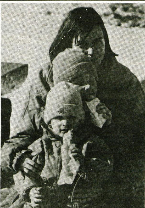
Sonce, zima, mraz in vroče hrenovke, foto: G. Šinik

Tokrat pa gremo s staro razglednico s častitljivim poštnim datumom 11. avgust 1907 spet malo v hribe in sicer na nadmorsko višino 1631 m. napišite nam, katera koča je na sliki in kaj se je z njo zgodilo.