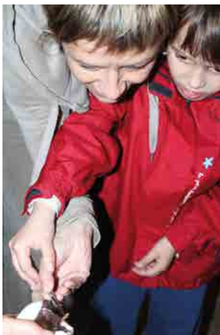
Onemogli netopirji igrajo pomembno vlogo pri premagovanju predsodkov in izobraževanju, še posebej, če lahko najditelji netopirja nahranijo kar sami.

so naključne najdbe med letoma 2009 in 2014 primarni vir podatkov o pojavljanju nathusijevega netopirja pri nas. Z netopirofonom sežemo tudi na področje, ki se ga pri običajnih raziskavah netopirjev (npr. državni monitoring, inventarizacije) ponavadi ne more pokriti, to so netopirska