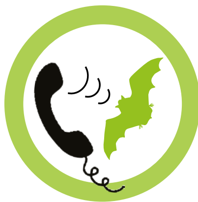
Novi logotip svetovalnega telefona za netopirje.

posebno, med netopirci že dolgo uporabljano ime – netopirofon – in svoj logotip. Vendar je tudi v vmesnih letih (2010–2014) brez kakršne koli finančne podpore z objavljenimi zasebnimi telefonskimi številkami članov in v njihovem prostem času deloval z enako vnemo na območju cele Slovenije. Svoj prosti čas, v primeru terenskega posredovanja pa tudi prihranke, je prostovoljno darovalo 10–15 članov društva. Naj (za)živi netopirofon! Mimogrede še to: v Sloveniji za pomoč