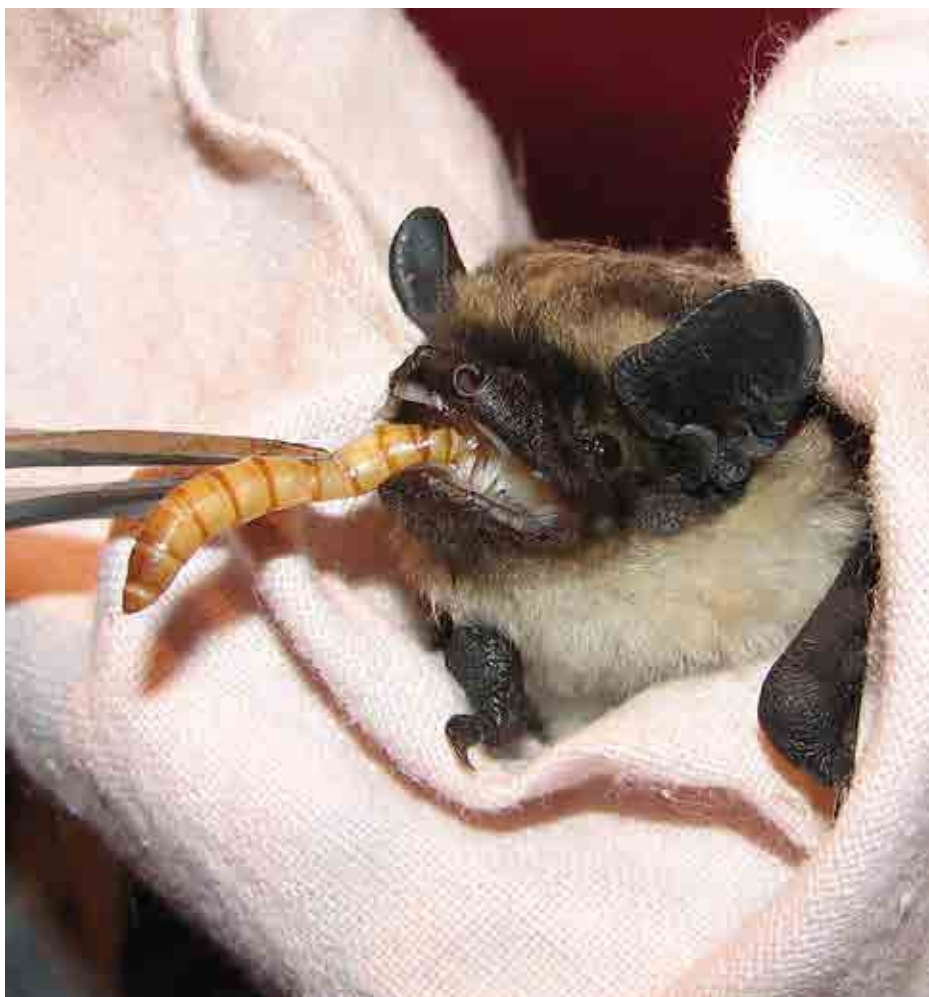
Hranjenje dvoobarvnega netopirja ( Vespertilio murinus ) v začasni oskrbi.

Zbiranje podatkov je pomembna dopolnitev k monitoringu netopirjev v Sloveniji, ki žal ni financirana s strani države. Za nekatere redkejšje ali težje zaznavne netopirske vrste, kot sta nathusijev in dvo-barvni netopir, je beleženje naključnih najdb namreč predlagana metoda monitoringa. Kot primer naj izpostavim, da