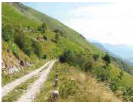
Stična cona navadnega gada, laškega gada in modrasa.

Življenjski prostor strupenjač na Stolu se bo glede na trenutne trende v prihodnosti bistveno spremenil. Južno pobočje se zaradi opustitve nekdanj prisotne sečnje, košnje in paše zarašča z grmovjem in drevjem. Med raziskavo smo opazili, da so zaradi zaraščanja ponekod že izginila