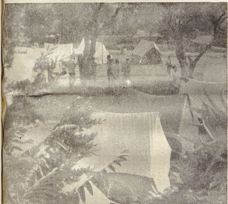
Štorski taborniki so letos taborili na otoku Hvaru. 15 dni na soncu v vodi je kaj hitro minilo. Vsi so bili zelo zadovoljni. Na sliki je njihov tabor.