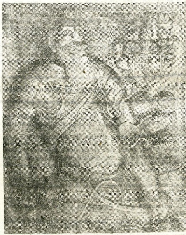
Jurij pl. Khisl, lastnik kranjskega gradu konec 16. stoletja