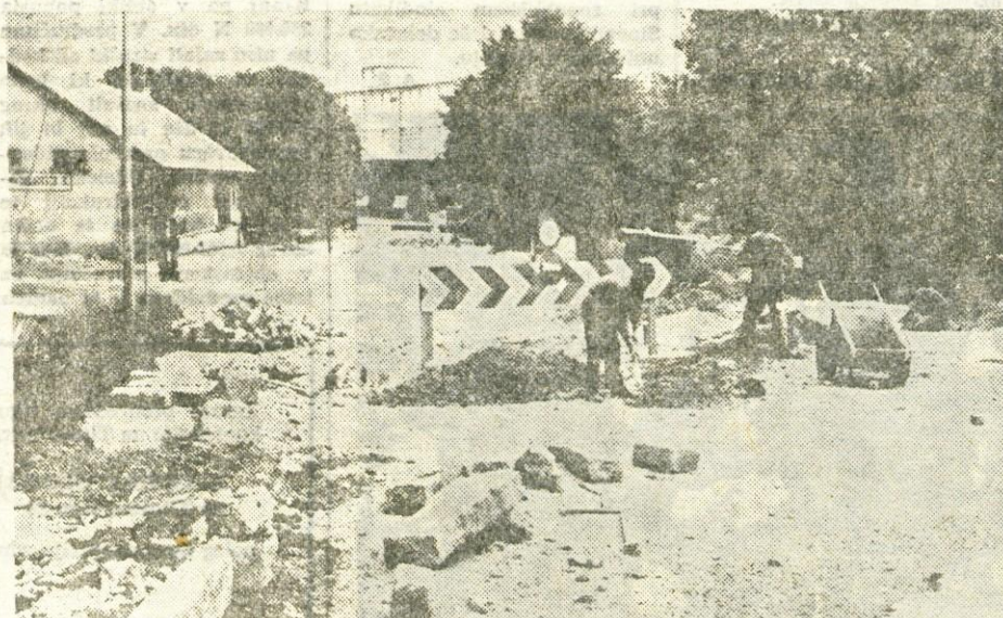
V Kranju delavci Komunalnega podjetja pravkar urejajo obvoz pri železniški postaji. Zaradi vse večjega prometa je tu posebno ob konicah prišlo do zastojev v prometu. Zato bodo sedaj uredili avtobusno postajališče za odhode proti Ljubljani pri sedanjem odcepu na železniško postajo (stari del ceste pa bodo za motorna vozila zaprli). Postajališče za odhode proti Kranju oziroma na Gorenjsko pa bodo uredili pred restavracijo tovarne Iskra