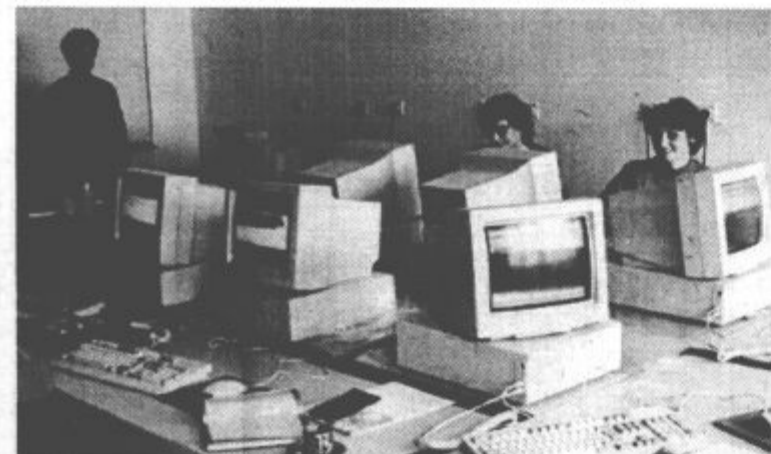
Sodobno opremljena lastna učilnica