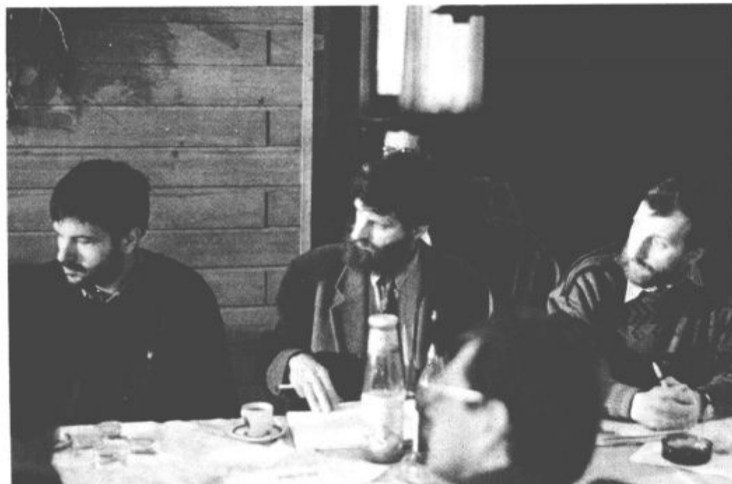
Govorili so o snegu, pogovori pa so bili vroči