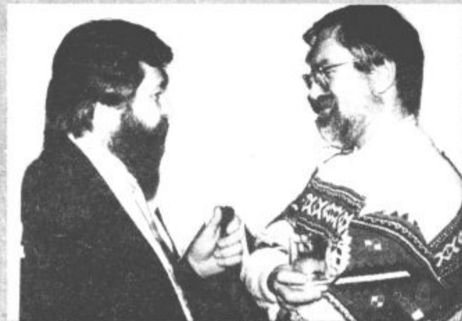
Že sama pobuda iz Velenja je bila vredna kozarčka.

Naš čas, d.o.o., je odločno zastavil nadaljnji medijski prodor. Po tistem, ko je Naš čas, časopis, postal regijsko zanimiv in ga z veseljem prebirajo tudi drugi, ne zgolj Šalečani, ko je Radio Velenje na novi frekvenci pričel oddajati vsakodnevno