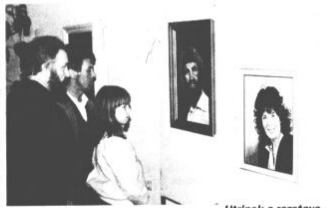
Utrinek z razstave.