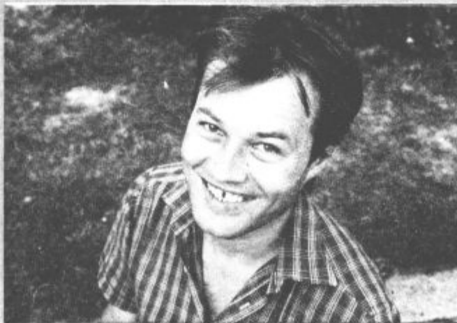
Bo prva kamera televizije Naš čas, ki bo oddajala na oddajniku Plešivec, vetevevec Dulo? Po nasmehu sodeč, pravi DA!

Naš čas, d.o.o., je odločno zastavil nadaljnji medijski prodor. Po tistem, ko je Naš čas, časopis, postal regijsko zanimiv in ga z veseljem prebirajo tudi drugi, ne zgolj Šalečani, ko je Radio Velenje na novi frekvenci pričel oddajati vsakodnevno