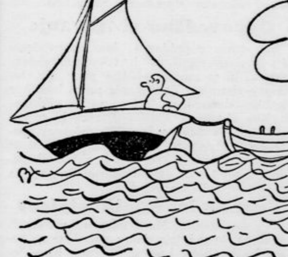
Pesimist gre na jadrano partijo...

Na koncu zborovanja je bila sestavljena resolucija, iz katere posnemamo: Že pol stoletja delujejo zadrugarji Jugoslavije z vso požrtvovalnostjo na področju narodne prosvete, gospodarskega napredka, socialne pravičnosti in miru. Kot sietza celokupnega jugoslovenskega zadrugarstva je zdravstveno zadrugarstvo, ki se je med ljudmi že močno zakoreninilo in je najvažnejša veja zadrugarstva sploh. Za naš narod je sistem zadrugarstva najkoristnejši družabno-gospodarski sistem