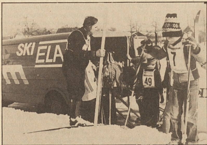
Servis trgovine ELAN hitro izpolnjuje zadnje želje tekačev.