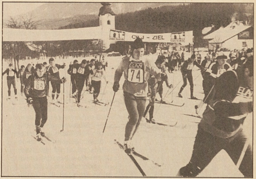
2. ljudski tek za ROŽANSKI POKAL je priredilo Slovensko prosvetno društvo »Kočna« v Svečah pod pokroviteljstvom NAŠEGA TEDNIKA in ELAN-trgovine na Brnci. 97 tekačev, od otrok do upokojencev, se je odzvalo vabilu.