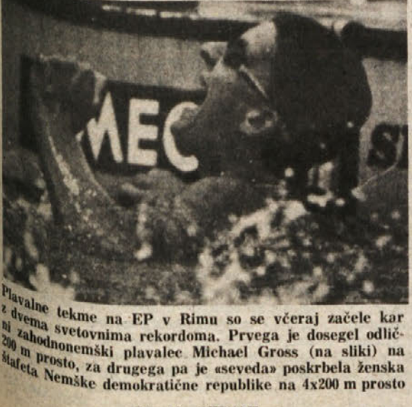
Plavalne tekme na EP v Rimu so se včeraj začele kar z dvema svetovnim rekordoma. Prvega je dosegel odlični zahodnonemški plavalec Michael Gross (na sliki) na 200 m prosto, za drugega pa je »seveda« poskrbela ženska štafeta Nemške demokratične republike na 4x200 m prosto