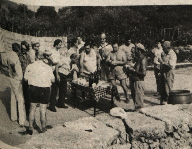
Ker je šlo zelo naglo od rok in ker je med domačini in gosti vladalo lepo, tovariško soglasje, je bilo prijetno tudi ob uri oddiha, ko so domačini pripravili gostom iz Doline majhen prigrizek in pa kozarec domačega, kar se je vsem zelo prileglo

V soboto, 20. t.m., zgodaj zjutraj je skupina Mačkoljanov prispela v Zazid, kjer so jo čakali domačini in kmalu so se družno lotili dela, ki ga bodo udarniško čim prej končali, kajti odkritje spomenika bo v nedeljo, 9. oktobra, teden dni prej, prav na dan smrti borcev, bo spominska svečanost v Mačkoljah, kjer bodo ob štiridesetletnici požiga vasi in smrti svojih vačanov priredili primerno komemoracijo.