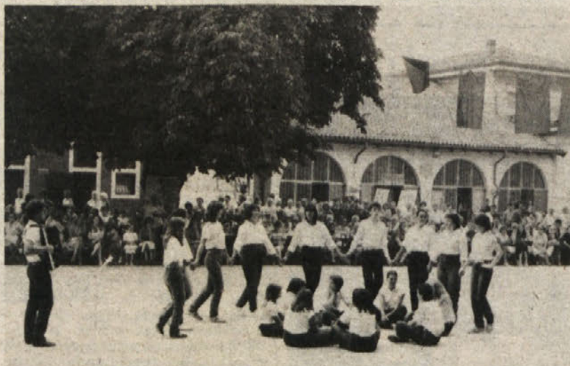
Na festivalu komunističnega tiska na Opčinah je bil v nedeljo popoldne kulturni spored, v katerem je med drugimi s svojimi plesi nastopila tudi folklorna skupina domačega KD Tabor