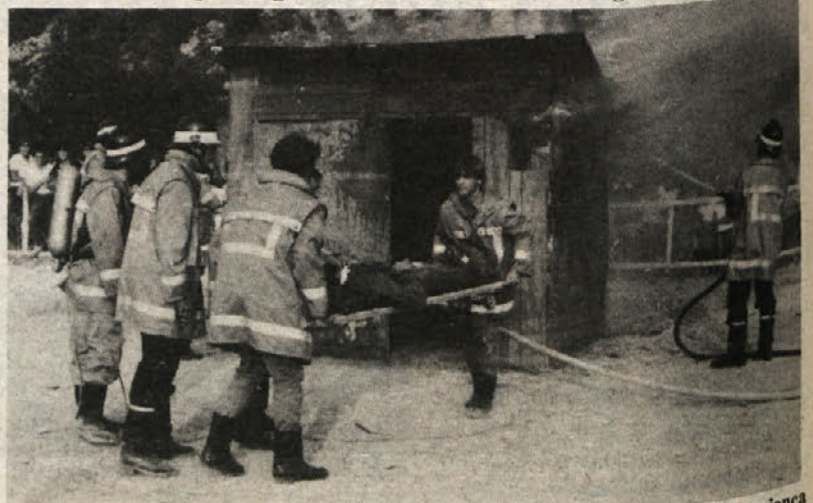
Reševalna akcija tržaških gasilcev. Iz barake v plamenih so potegnili ranjenca