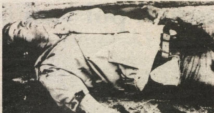
Truplo Benigna Aquina na letališču v Manili, kjer so ga ubili po povratku na Filipine. Aquino je bil voditelj filipinske opozicije in je veljal za človeka, ki naj bi v tej državi ponovno vzpostavil demokracijo