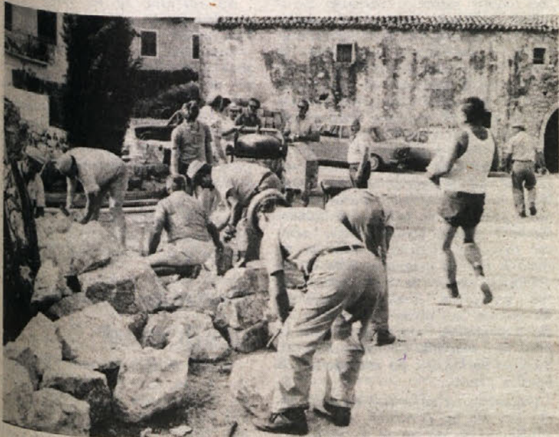
Skupina članov mačkoljskega Kulturnega društva Primorsko ter bivših partizanov se je skupno z domačini iz Zazida, male vasice v slovenski Istri, pod Slavnikom, v soboto zjutraj ročno lotila dela, tako da je »šel zid« kar naglo navzgor...

Iz Mačkolj je padlo v Zazidu v slovenski Istri osem mladeničev in prav toliko je padlo mladeničev iz Zazida