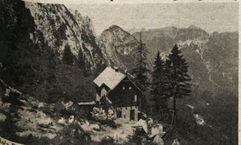
Koča Pellarini (1502) pod Višem z obronki Nabois na levi in zgornjim delom doline Zajzere na desni ter vrhom Poldanšnje špice v ozadju

S počitniškega sprehajanja po naravnih krasotah slovenske dežele