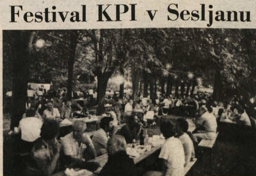
Včeraj se je zaključil festival komunističnega tiska v Sosljanu

Dolina, Kroglice, Tinjan, Smedela, Žavljje, 23. avgusta 1983