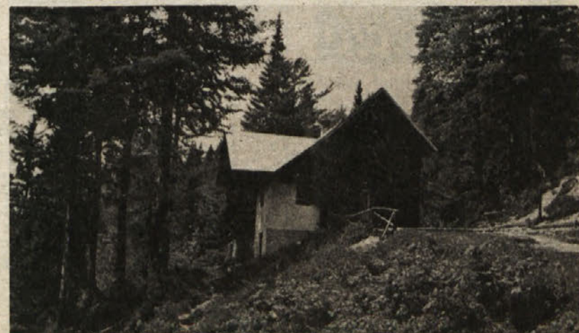
Koča Zacchi (1380) visoko nad zgornjim Belopeškim jezerom pod Poncami