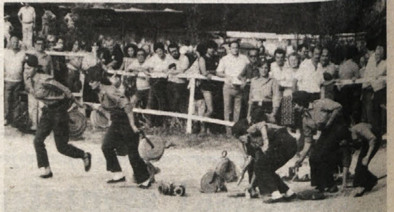
Članice gasilskega društva od Hrvatitnov med gasilsko vajo