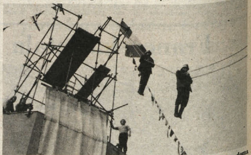
Eden od zahtevnih akrobatskih prikazov. Po vrvi s strehe Kulturnega doma