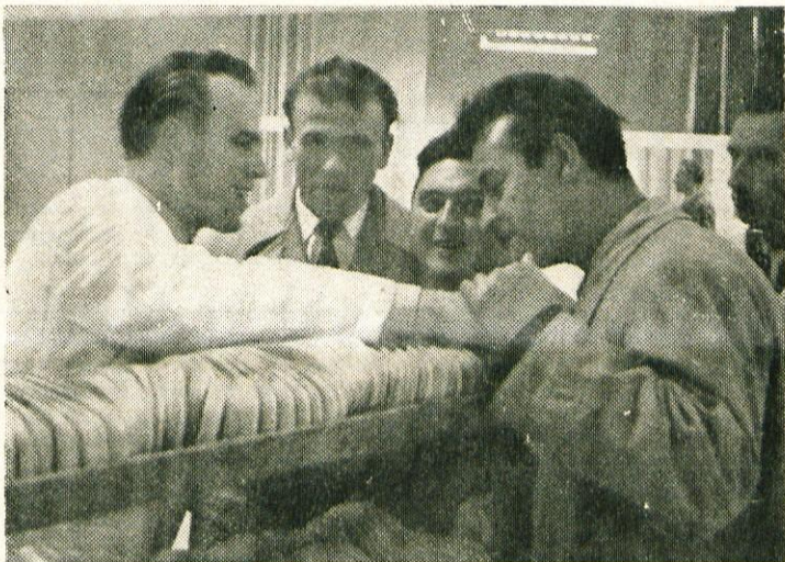
Tuji in domači gosti so se živo zanimali za proizvodni proces v Peko

V Peko imajo stalne težave zaradi zgornjega usnja, ki ga težko dobijo, poleg tega pa je zelo slabo in zato je težko izdelovati lepe čevlje, kakršne potrebuje zahteva. Prav zaradi slabe kvalitete zgornjega usnja, je tudi mnogo čevljev defektnih in to precej znižuje zaslužek celotnega kolektiva.