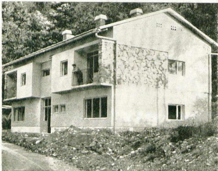
Elektro Kranj je zgradil na Cankarjevi cesti stavbo, v kateri bodo upravni prostori in še dvoje stanovanj

Gospodinjstvo pomočnico, pridno in pošteno, sprejme takoj Nadišar, Trg svobode 20.