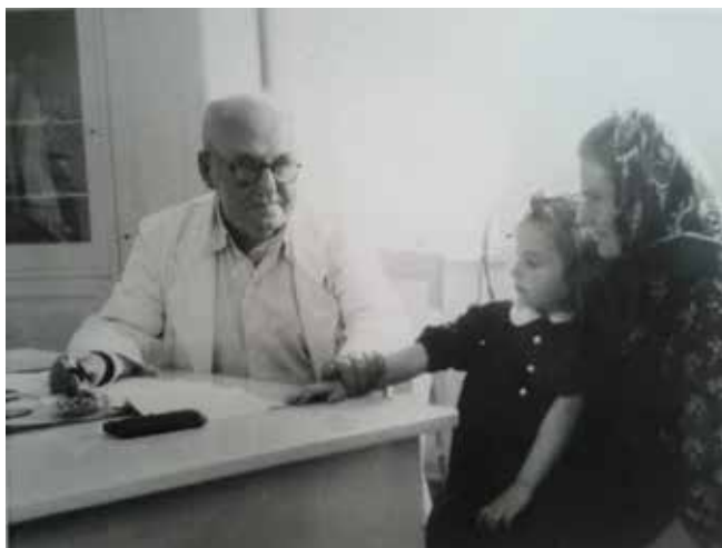
»Naš očka doktor« pri pregledu male pacientke v Ivanjkovcih.