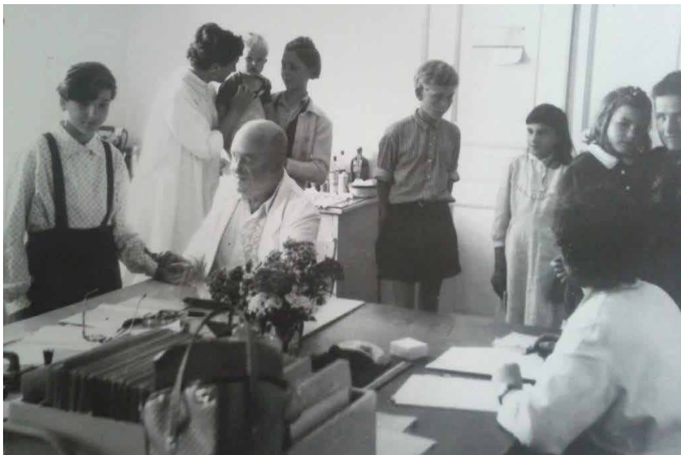
Mladina na sistematskem pregledu v Ivanjkovih.

24. 8. 1961 Spoštovani gosp. Primarij! Vaš cenjen pismo dobesno prejel. Z veseljem brdem uskegel Vaši prošnji in bom močnikaj zanimivega, kar datus in mltkomu več znano naroen dneva, Vašemu kvalifikacnemu delu doprinesel. V petek dne 27. 1. m. Vas namučavam obiskati zaradi konzultativnega pregleda pri pacijentu v dermatološkem odelu. Upam, da Vas bom našel in prosim, da mi to nadlegovaje sporočite. Zdravim vas in Vašo Mladi B. Čopić Jom.