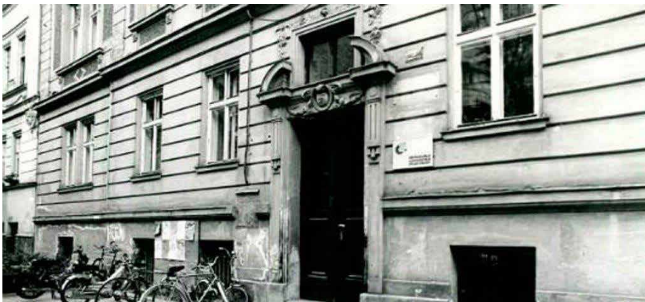
Zgradba v Maistrovi 5, danes sedež Andragoškega zavoda Maribor. 30