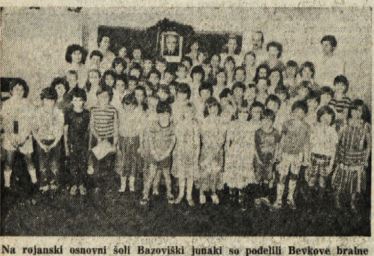
Na rojanski osnovni šoli Bazoviški junaki so podelili Bevkove bralne značke, kot poročamo tu zraven