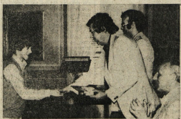
Avtorji so prejeli literarne nagrade, tisti iz druge in prve kategorije pa še bon za nakup knjig, oziroma drugih potrebščin v vrednosti 25, oziroma 50 tisoč lir.

V Attemsovi palači na Koru, ki ji trenutno obnavljajo pročelje, je bila včeraj dopoldne prijetna svečanost, na kateri so nagradili avtorje najboljših literarnih prispevkov o Soči. Natečaj je, kakor znano, razpisala goriska pokrajinska uprava, v sodelovanju z društvom Italia nostra, bil pa je namenjen dijakom tretjih razredov nižje srednje šole.