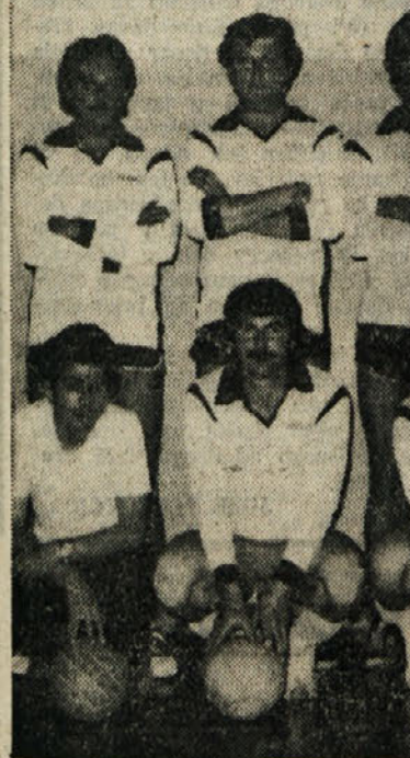
Moška šesterka Sloge (na sliki) je na odbojškem srečanju 81, ki se je končal v nedeljo v Bazovici, z zmago proti Piprjem zasedla prvo mesto. Na turnirju je poleg Sloge nastopilo še šest moških ekip, v ženski vrsti, kjer so se prav tako uveljavile slogašice, pa so bile štiri. Celotno tekmovalje je v glavnem povsem uspelo, saj je bila družabnost, ki je osnovni cilj podobnih tekmovalj, prisotna na vsakem koraku