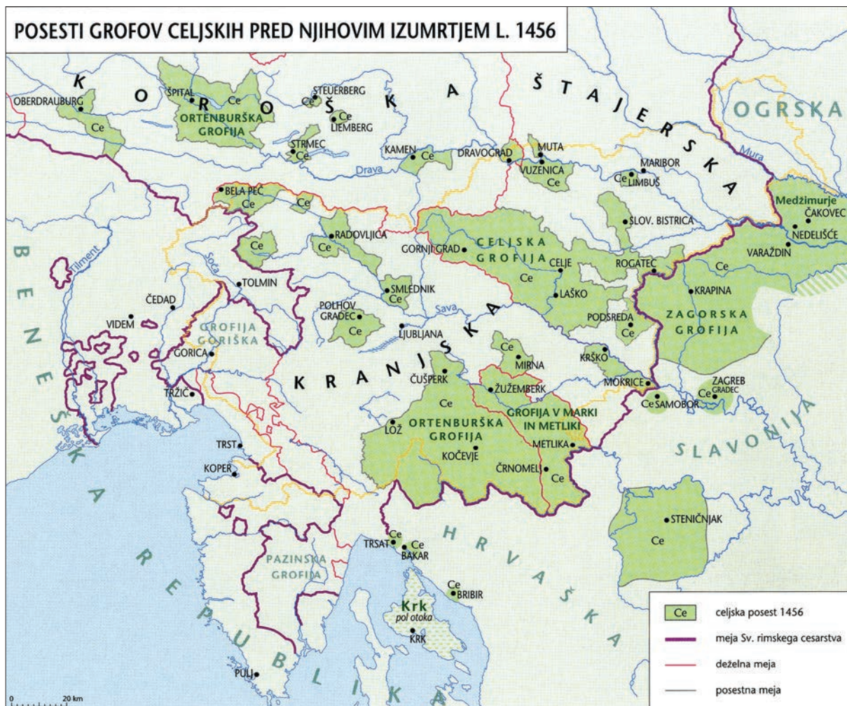
Posesti grofov Celjskih pred njihovim izumrtjem leta 1456 (Slovenski zgodovinski atlas, str. 89).

dvor, čeprav za to nimamo opore v virih. 10 Vse od smrti Ulrikovega sina Viljema (u. 1392), o čigar dvoru ne vemo ničesar, do polnoletnosti Friderika II. (r. ok. 1379, u. 1454) je obstajal samo en dvor, ki ga je vodil oče slednjega, Herman II. (r. ok. 1361, u. 1435), kasneje pa sta svoj dvor imela tudi Friderik II. in njegov sin Ulrik II. (r. ok. 1406, u. 1456). O dvoru drugih dveh sinov Hermana II. – Ludvika (u. 1414) in Hermana III. (u. 1426) – ne vemo ničesar, saj se v virih skoraj ne omenjata.