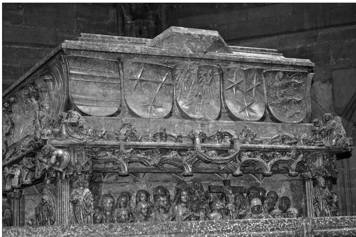
Grbi dediščine grofov Celjskih na prednji strani nagrobnika cesarja Friderika III. v cerkvi sv. Štefana na Dunaju. Od leve proti desni žovneški, celjski, ortenburški, sternberški in zagorski grb.