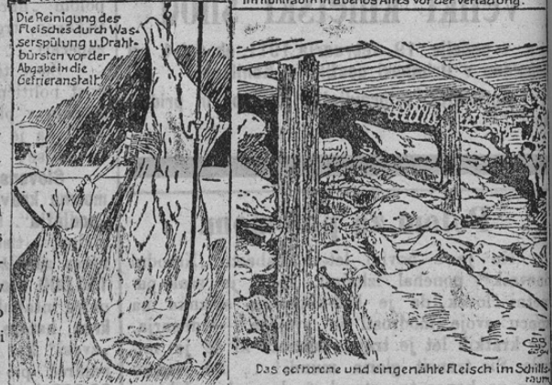
Zur Einführung argentinischen Fleisches in Oesterreich.