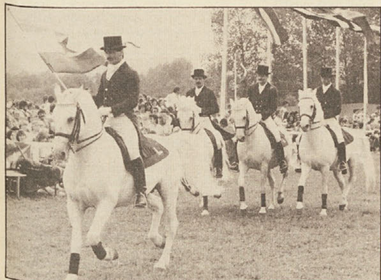
„Beli balet“ iz Lipice je bil glavna atrakcija v Klopincu