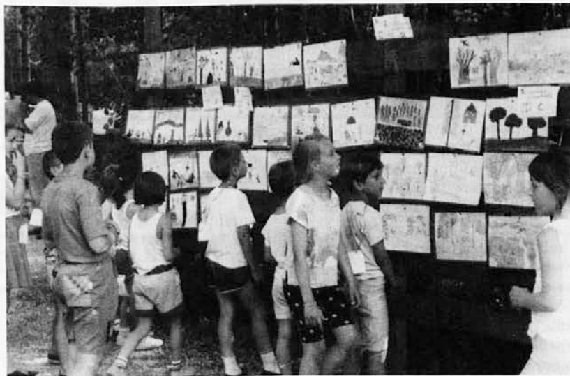
Posnetek z lanske šagre v Praprotu — udeleženci ex-tempore si ogledujejo izdelke svojih sovrstnikov

Kot je rekel tajnik Doljak, bi društvo rado priredilo kaj zanimivega tudi za mlade, vendar mo-