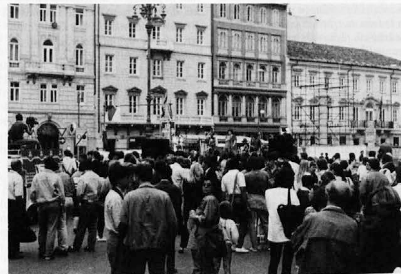
Posnetek s koncerta na Borznem trgu v Trstu z znano slovensko skupino Agropop na enem zadnjih volilnih shodov Ssk