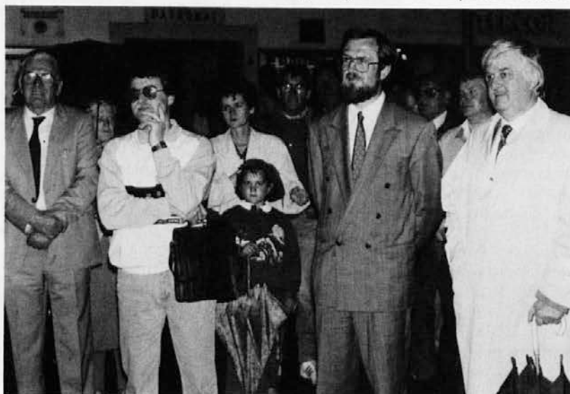
Bivši predsednik slovenske vlade Lojze Peterle na zaključnem volilnem shodu Ssk v Nabrežini v petek, 5. junija

Dolžan sem zahvalo vsem, ki so pripomogli k strankinemu in mojemu — osebnemu — uspehu ter vsem, ki so mi v tem predvolilnem boju stali ob strani: z navetom in organizacijsko pomočjo. Upam, da vas, dragi Slovenci in Slovenke, ne bom razočaral!