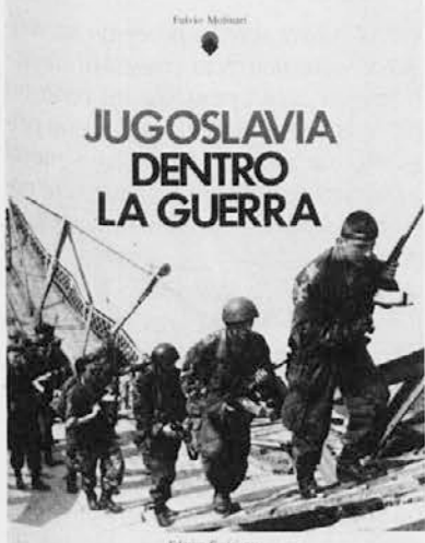
Naslovna stran Molinarijeve knjige

Zahod se zelo počasi prebujajo, ko pa se zave svojega spanca, ki ga samo potrjuje v blaženem ugodju, se naenkrat zave in to označja celemu svetu, da je vse že prej vedel, a da ni nič naredil, da bi bilo bolje. Trditve je zelo posrečene tudi za vse tiste, ali skorajda vse, ki se sedaj šopirijo z (ne)poznavanjem vojne, mesarskega klanja, na tleh zdaj že nekdanje Jugoslavije.