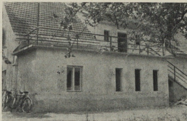
Prigrajeni del ambulate Induplati