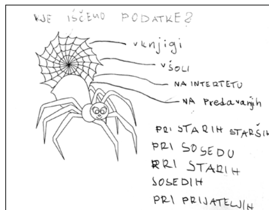
Slika 4: Delovni list z vprašanjem Kje iščemo podatke?

Vsi učenci, tudi učenci s posebnimi potrebami, ki obiskujejo OŠ PP NIS, so lahko uspešni. Pri tej uri so bili. Dokaz za to je tudi opravljena domača naloga, kjer so vsak zase glede na svoje sposobnosti in zmožnosti izpolnili delovni list (Slika 4).