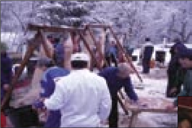
Tri gauge (šrage) pa šest pau svinj. Te kej je vido tisti, šteri je kaulek pau 11. vöre prišo na Gorenji Senik

Farkaš, šteri ima oddajo na radio-ni Murski val »Geza se zeza«. Un je spejvo pa s svojimi vici pa štorija-