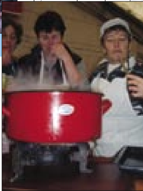
Velki pisker pa tri kūjarce