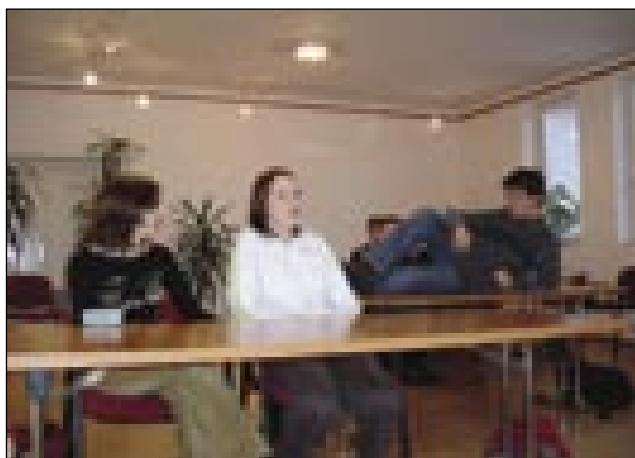
Dijaki monoštrske gimnazije pripravljajo letošnjo igro v knjižnoj rejči

Na svojo drugo predstavo se pripravljajo mlajši iz Mladoga porabskoga gledališča tö. Že eden čas delajo na predstavi Prvi den šoule. Lani so v svojoj prvoy predstavi gučali v domanjoj rejči pa v knjižnoj slovensčini. Tou leto do na prvi den šoule gučali samo v knjižnom