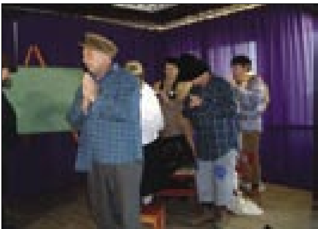
Gledališka skupina Veseli pajdaši ZS iz Števanovec