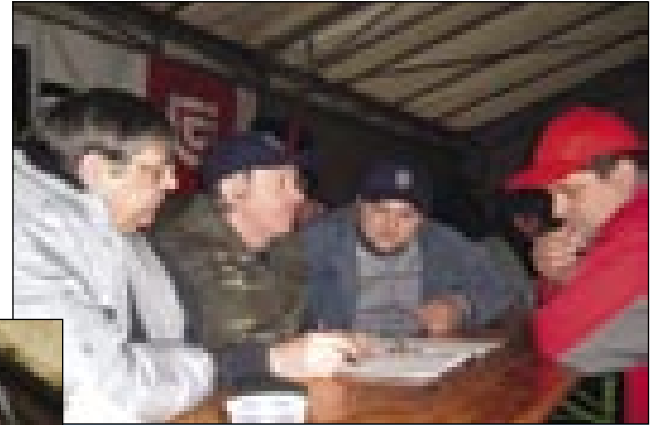
Žirija nej mejla léko delo

je delala hurke, repo, krompir. Domanji, Seničarge pa so meli hurke, klobase pa nadenjeno kapüsto. Tak ka gesti je bilau dosta, pa vsefele. Kelnarge so tö dosta dela meli, ka je lüstvo žedno tö bilau. Med dnevom so dekle odavale tombole (srečke), vsakši,