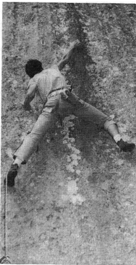
Prva devetica v Soški dolini, smer Opus del

Poleg teh bo potrebno bolje reševati tudi kadrovske probleme. Soški AO včasih namreč deloma izgublja svojo prvotno zasnovo, saj se največ dogaja v Tolminu, manj pa v drugih perifernih krajih, kar se pozna tudi pri članstvu.