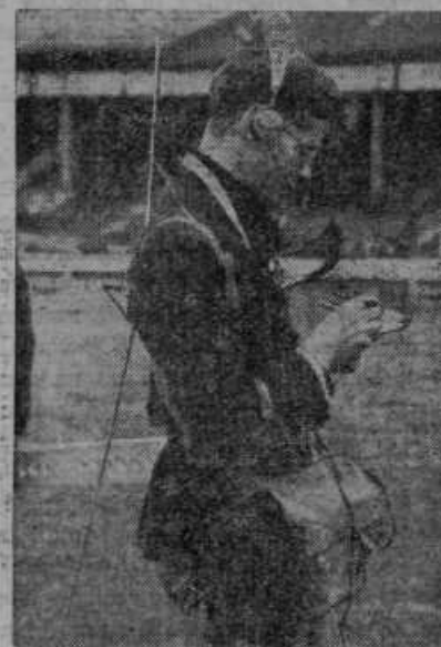
Z radio oddajno in sprejemno postajo opremljeni časnikarski poročevalci.