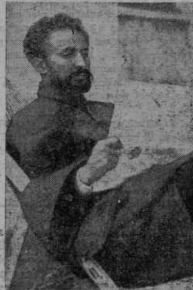
Bivši abesinski cesar Haile Sellasie čita v angleškem kopalšču časopis.