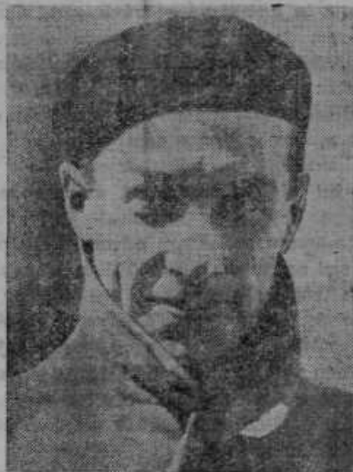
Kapitan Burzynski, poljski letalec, se hoče povzpeti v izredne zračne višine z največjim balonom na svetu, da bi pobil svetovni rekord Amerikanca Stevensa, kateri znaša 22.000 metrov.

skoraj enake po letih in po značaju. Prvo smo spremljali na kraj smrtnega počitka Marijo Šumenjak iz Preroda. Podlegla je oslabljenju srca v 64. letu starosti. Dva meseca je bila na bolniški postelji in voljno prenašala trpljenje. Bila je pridna in radodarna žena. Rada je hodila k sv. maši in prejela sv. zakramente. V nje-