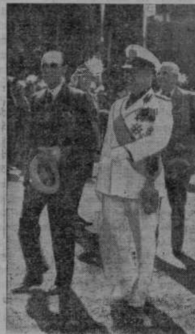
Mažarski ministrski predsednik Imreedy v Mussolinijevem spremstvu v Rimu.

Pri gotovih boleznih žolča in jeter, žolčnega kamna in zlatence urejuje naravna »Franz-Josefova« grenka voda prebavo in pospešuje izpraznjenje črev. Kliniške izkušnje potrjujejo, da domače zdravljenje dobro učinkuje, ako se jemlje zjutraj na tešče »Franz-Josefova« voda pomešana z nekoliko vroče vode. (Ogl. reg. S. br. 15.485/35.) 1138