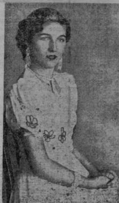
Princezinja Fawzia, 16 letna sestra egiptovskega kralja, se bo poročila drugo leto s prestolonaslednikom kraljevine Irana v osrednji Aziji.

Pri gotovih boleznih žolča in jeter, žolčnega kamna in zlatence urejuje naravna »Franz-Josefova« grenka voda prebavo in pospešuje izpraznjenje črev. Kliniške izkušnje potrjujejo, da domače zdravljenje dobro učinkuje, ako se jemlje zjutraj na tešče »Franz-Josefova« voda pomešana z nekoliko vroče vode. (Ogl. reg. S. br. 15.485/35.) 1138