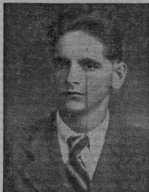
Za izsleditev tovornjakev vozila kmetin je razpisala banovina nagrado 3000 din.

Betnava se pripravlja na vaš prihod. Dekleta, pridite vse!