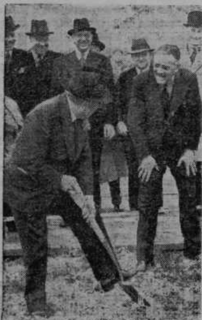
Kingsley Wood, angleški minister za letalstvo, zasaja lopato v zemljo na prostoru, na katerem bo pozidana ogromna avtomobilska tvornica lorda Nuffielda v Birminghamu.