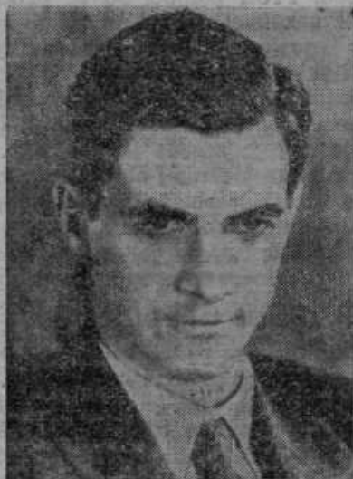
Ameriški letalec H. Hughes je dosegel svetovni rekord, ker je srečno končal v 91 urah polet okrog sveta.

Polensak pri Ptuj. Letos pri nas gospodarji smrt med ženskim spolom. V kratkih presledkih je pobrala kar tri žene-gospodarice, ki so si bile