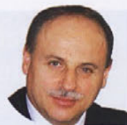
Piše: Jože Povšič

Obljubil je, da bo »prednostno« zagotovil pločnik ob cesti Dolenja Nemška vas – Gorenje Ponikve in obnovo mostu preko reke Temenice. Nič od tega! Obljubil je »vitalno« ureditev centra Trebnjega v prometnem, komunalnem