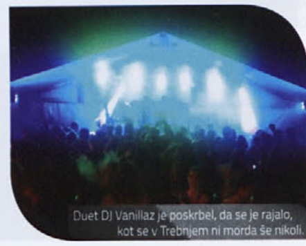
Duet DJ Vanillaz je poskrbel, da se je rajalo, kot se v Trebnjem ni morda še nikoli.