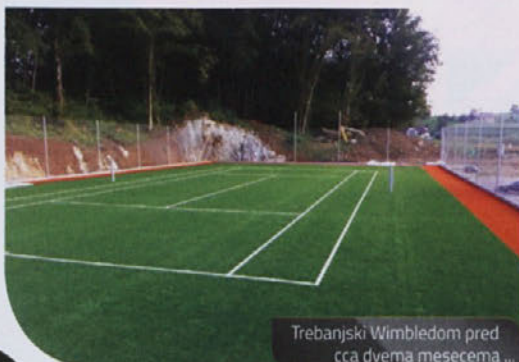
Trebanjski Wimbledon pred cca dvema mesecema ...