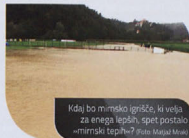
Kdaj bo mirnsko igrišče, ki velja za enega lepših, spet postalo »mirnski tepih«?

Mirncani so lahko upravičeno ponosni na že kar 46-letno zgodovino svojega nogometnega kluba, nedvomno pa so lahko ponosni tudi na svoje osrednje nogometno igrišče, katerega so v zadnjih letih dodelali tako zelo, da se lahko kosa celo z najboljšimi oz. najlepšimi v državi. Zato niti ne čudi zapis trenerja mirnsko-trebanjskih nogometašev, ki je ob poplavljenem igrišču z žalostjo ugotovil, da je šlo po zlu veliko truda vloženega v stadion. Prepričani smo, da bodo Mirncani tudi tokrat znali stopiti skupaj in igrišče spraviti v staro stanje, saj bodo pri tem nedvomno imeli podporo s strani nogometašev, njihovih staršev, uprave kluba, ostalih Mirncanov, pa nenazadnje tudi občinskega vrha.