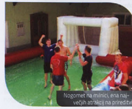
Nogomet na milnici, ena največjih atrakcij na prireditvi.