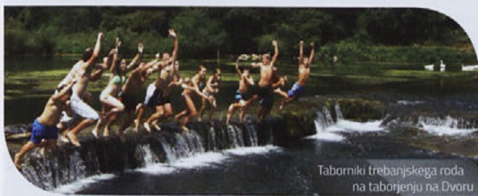
Taborniki trebanjskega roda na taborjenju na Dvoru

Nekateri so prvič preživeli teden dni v naravi, kjer so spoznali, kako "fajn" se je za nekaj časa odklopiti od današnjega sveta. Ob vročih popoldnevih smo se hladili v reki Krki, ko je deževalo, smo se zabavali pod štabnimi šotori, ob večerih smo ob ognju pekli kruh, hrenovke in ostale dobrote. Ko smo si zahoteli še nekaj "drugačnega", smo se odpravili na pohod, vožnjo s kanuji, nekateri starejši pa