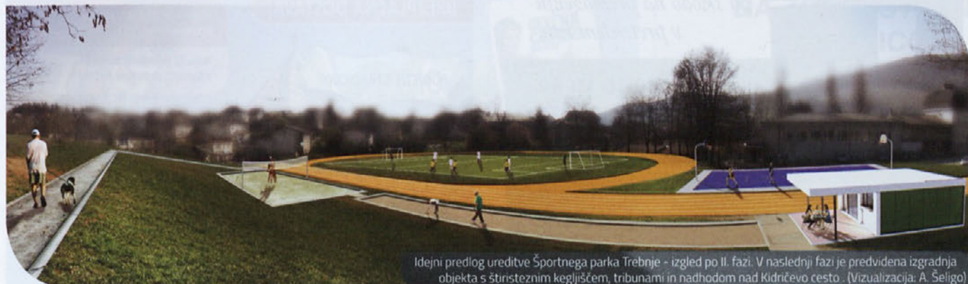
Idejni predlog ureditve Športnega parka Trebnje - izgled po II. fazi. V naslednji fazi je predvidena izgradnja objekta s štirinastimi kegličjem, tribunami in nadhodom nad Kidričevo cesto. (vizualizacija: A. Seligo)

Igrišče je v osnovi danes prehodno, saj ga številni prebivalci uporabljajo za najkrajšo povezavo med severnim in južnim delom mesta, ter med zahodnim in vzhodnim delom centra mesta, saj se dejansko nahaja v samem osrčju Trebnjega. V idejni zasnovi smo zato predvideli tudi izgradnjo peš poti na severnem delu igrišča ter povezavo na obstoječo pot, ki vodi po vzhodni strani igrišča in pa izgradnjo stopnic na zahodni strani igrišča. Tako bi vsem krajanom omogočili kratke mestne povezave.