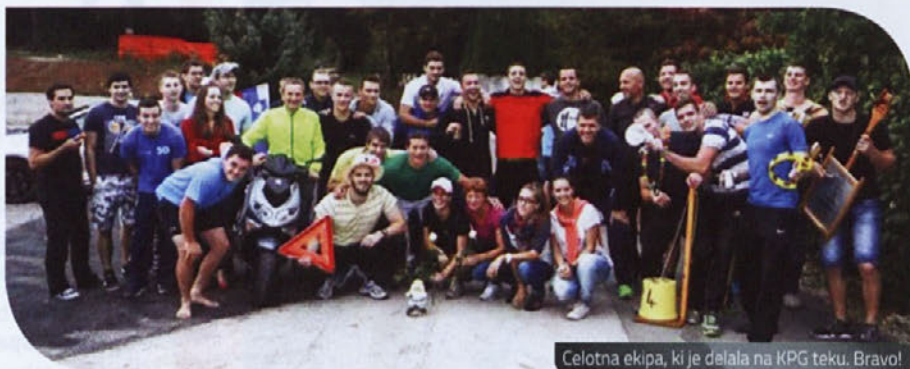
Celotna ekipa, ki je delala na KPG teku. Bravo!