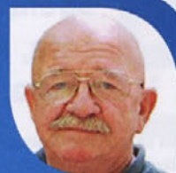
Piše: Brane Praznik

In še: Kdo naj brani naš, vaš, torej skupen interes v prostoru kjer živimo. Logičen odgovor: občina in župan, ki jo predstavlja. Vse skupaj morda še ne bi bilo tako katastrofalno, če bi občine (vsaj njihov upravni del) in župani reagirale vsaj letošnjo pomlad (informacije o gradnji so bile sicer posre-