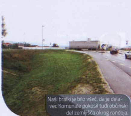
Naši bralki je bilo všeč, da je delavec Komunale pokosil tudi občinski del zemljišča okrog rondoja.

Še enkrat smo dokazali, da - radi grajamo, še raje pa pohvalimo . Če poznate tudi vi koga, ki si zasluži pohvalo, nam to sporočite (info@cajtng.com). Polepšajte nekemu dan, če si to zasluži ... Saj veste, kako vedno pravimo: "Tako malo je potrebno, da smo srečni ..." (TK)