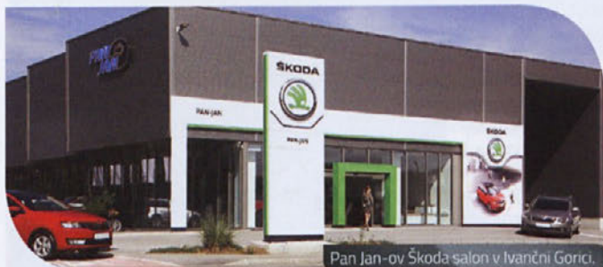
Pan Jan-ov Škoda salon v Ivančni Gorici.

Vabljeni tudi v Pan Jan-ov salon v Ivančno Gorico. V salon, ob katerem zaigra srce ... (TK)