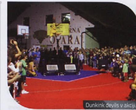
Dunking devils v akciji.