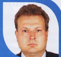
Piše: Gregor Kaplan

A kaj naj s temi nesrečnimi kolesarji? Kak me-ter kolesarske steze tu pa tam sicer je zarisane in če se bi našel še kak kilogram barve, bi se vsaj lahko zarisala kolesarska steza čez Trebnje, ter morda tudi na tak način opozorilo na ranljivejšo kategorijo udeležencev v prometu. Za to resnično ni potrebno veliko in je prava malenkost. Za začetek bi jo morda lahko zarisali vsaj do Štefana, Benečije, Račjega sela in Ponikev. Nekaj prog za kolesarjenje po naši občini že imamo - skoraj pol ducata, bi nam povedali na TIC-u, kar je zelo pohvalno. Tudi dve kolesi sta na voljo na TIC-u za brezplačno uporabo. S samo oznako kolesarske steze sicer kolesarji v prometu ne bodo bistveno