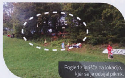
Pogled z igrišča na lokacijo, kjer se je odvijal piknik.