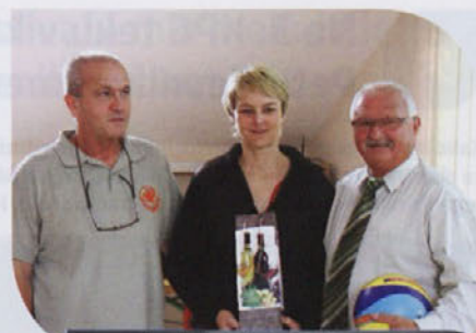
Predsednik Strokovne komisije ZOSS, predsednica predsedstva ZOSS in župan Občine Mokronog- Trebelno skupaj odprli seminar.

Seminar se je nadaljeval izobraževalno, s poudarkom na izboljševanju sojenja in odnosov med