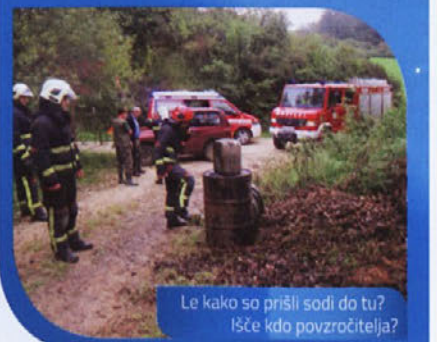
Le kako so prišli sodi do tu? Išče kdo povzročitelj?

V četrtek, 4. 9. 2014, ob 9:35 je v kraju Gorenje Medvedje selo v občini Trebnje, pri pekokopu na divjem odlagališču, iz dveh 100 litrskih sodov iztekalo odpadno olje. Izteklo je približno 15 litrov olja. Gasilci PGD Trebnje so zavarovali kraj in preprečili nadaljnje iztekanje. Do onesnaženja okolja ni prišlo. O dogodku so bile obveščene pristojne službe. (MJ)