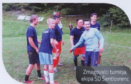
Zmagovalci turnirja, ekipa ŠD Šentlovrenc