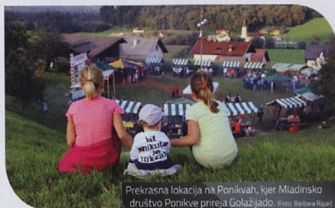
Prekrasna lokacija na Ponikvah, kjer Mladinsko društvo Ponikve prireja Golažijado.