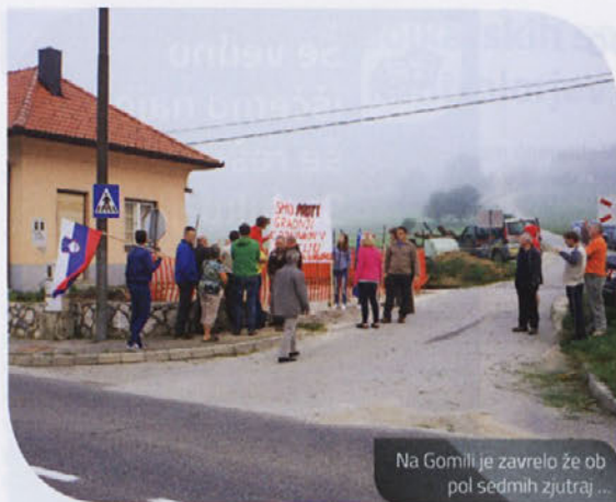
Na Gomili je zavrelo že ob pol sedmih zjutraj ...

staje. Kot smo uspeli izvedeti, delavci niso ničesar delali na silo, so se pa mirno prestavili naprej in z izgradnjo bazne postaje nadaljevali v Slovenski vasi pri Šentrupertu.