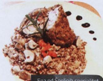
Ena od Špelinih specialitet, ki pa ni prepričala šefa.

»S polno paro že komponiram nove projekte in seveda tudi nove krožnike. V svoji kuhinji sem omejena pretežno na domače, avtohtone sestavine, saj smo izletniška kmetija, tak krožnik sem pripravila tudi šefu. V prvi verziji sem želela pripraviti, rulado iz piščančjega fileja s slanino v lešnikovi skorji, nakar sem ugotovila, da bi me piščančja rulada v pičlih 30-tih minutah pokopala že prvi dan, saj je gotovo ne bi uspela pripraviti pravilno. Tako sem se odločila za piščančji file z bio sezamovimi semeni. Krožnik je bil pripravljen s sezonskimi in domačimi sestavinami – ajdovo kaša sortirano v smetanovo – jurčkovi omaki, pisana gomoljna