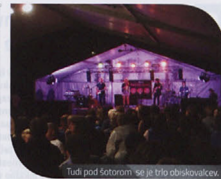
Tudi pod sotorom se je trlo obiskovalcev.

tem na Kitajskem na 2. olimpijskih igrah mladih prejela zlati medalji.