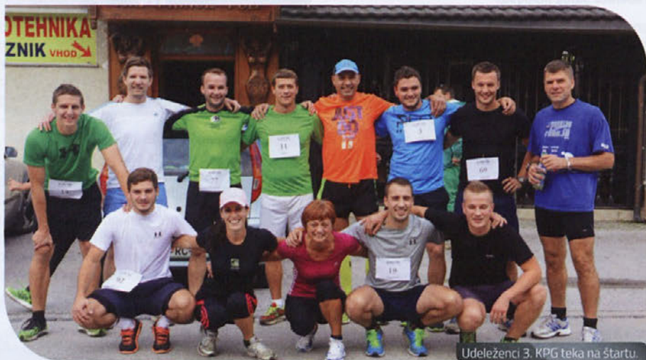
Udeleženci 3. KPG teka na štartu.