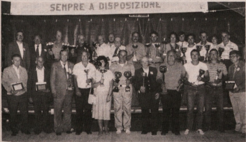
Skupinska slika nagrajencev

Kmetijski dnevi 1984 so dosegli višek v nedeljo popoldne, ko je bilo v šotoru nagrajevanje kmetovalcev in živinorejcev, ki so se udeležili različnih pobud, ki so potekale v okviru praznika.