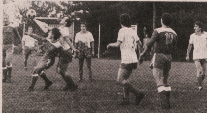
Posnetek s finalnega srečanja med Zarjo in Primorcem

Proti takemu, tekmeču poštvovalni nogometaši Primorca so se sicer srčno vrgli v boj, kaj več pa niso mogli proti razigranim Bazovcem tudi zato, ker so nastopili brez nekaterih ključnih nogometašev.