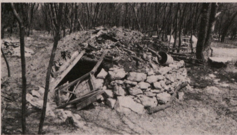
Takole izgleda podzemsko »zaklonišče« v zgoniški občini