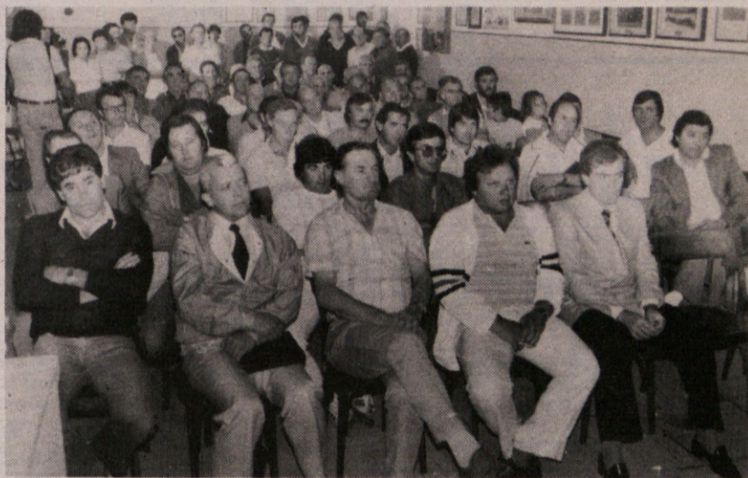
Svečane proslave 60-letnice delovanja proseškega Primorja so se udeležili številni člani, bivši predsedniki društva in številni gostje, ki so s svojo prisotnostjo počastili ta pomemben jubilej