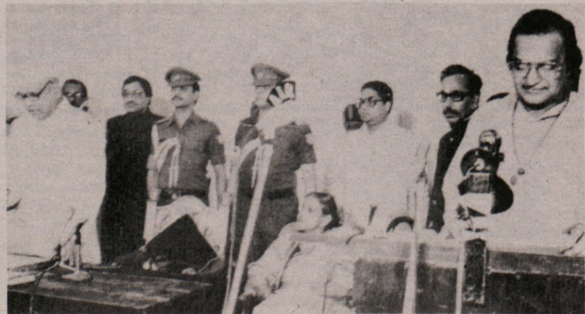
Predsednik vlade indijske zvezne države Andra Pradeš Rama Rao (desno) je ponovno prevzel svojo funkcijo. Indira Gandhi je morala kloniti pred protesti javnosti in iz strahu, da bi indijska opozicija našla skupen in enoten jezik