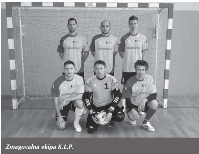
Zmagovalna ekipa K.L.P.

Poleg zimskih OI v Sočiju je bilo v tem letnem času tudi dogajanje v Trzinu športno obarvano, vsaj kar se tiče najbolj priljubljene igre z žogo: drugo februarso soboto je namreč več kot sto nogometnih zanesenjakov že enajsto leto zapored zasedlo veliko športno dvorano treh imen (Pekel, Ringelšpil ali Karuzel), vsem nam pristrčno domačo telovadnico v OŠ. Naša občina je znova gostila najboljše žogoborce od blizu in daleč na tradicionalnem Valentinovem malonogometnem turnirju (dogodek sam je že zdavnaj prerasel okvire občinskega tekmovanja – udeležba zvencev ekip to iz leta v leto le še potrjuje), 12 moštev pa se je za lovriko najboljšega v Trzinu pričelo meriti v kvalifikacijskih skupinah že v zgodnjih jutranjih urah.