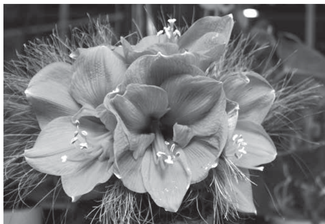
Cvetlice za vaš praznik

Zgodovina nas uči, da so ponekod v preteklosti poznali celo matriarhat, ureditev, pri kateri so imele žene glavno besedo. Dobro so vedele, kako živeti, delovati in celo voditi skupnost. Vendar je sčasoma prevladal patriarhat, saj so pri bojevanju moški imeli prednost. Ženske so delale, rojevale, moški pa so se bojevali. Da danes ženske lahko praznujejo, je plod odločnih prizadevanj žensk, da bi spet pridobile veljavo, ki jim gre. Ta se še zlasti izkaže v kriznih časih. Že v prvi svetovni vojni je bila na primer tako rekoč vsa obremenitev za preživetje slovenskega naroda na njihovih ramenih, saj so praktično vsi dela sposobni moški morali služiti cesarju na soški in drugih frontah. Med drugo svetovno vojno so bile številne ženske že enakopravne soborke in organizatorke odpora proti nacizmu in fašizmu. Ker je vojna terjala še zlasti hud davček med moškimi, je tudi obnova porušene domovine prav od žensk terjala še posebej veliko odrekanih, požrtvovalnosti in energije. Tudi v vojni za Slovenijo so trepetale za življenja svojih moških. V današnjem kriznem času spet nosijo sorazmerno veliko breme za preživetje družin, saj je marsikateri moški brez službe, ženska neupogljivost duha je spet v polni veljavi. So znanstvenice, odločne političarke, matere, žene in življenjske sopotnice, ki jih cenimo in imamo radi.