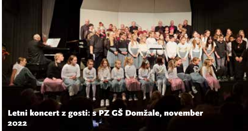
Letni koncert z gosti: s PZ GŠ Domžale, november 2022