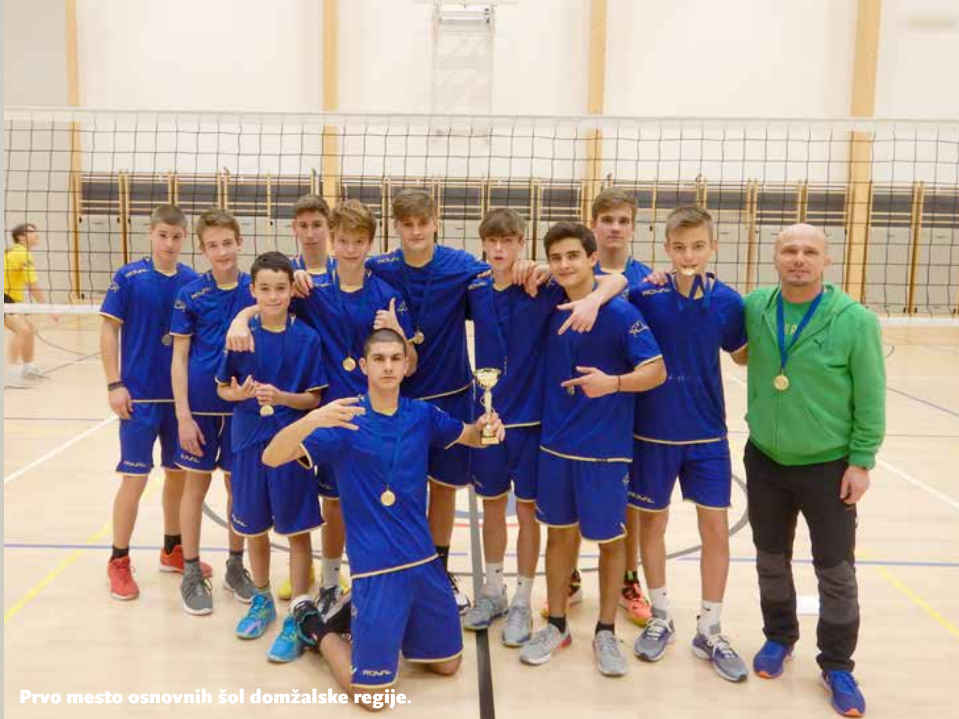
Prvo mesto osnovnih šol domžalske regije.