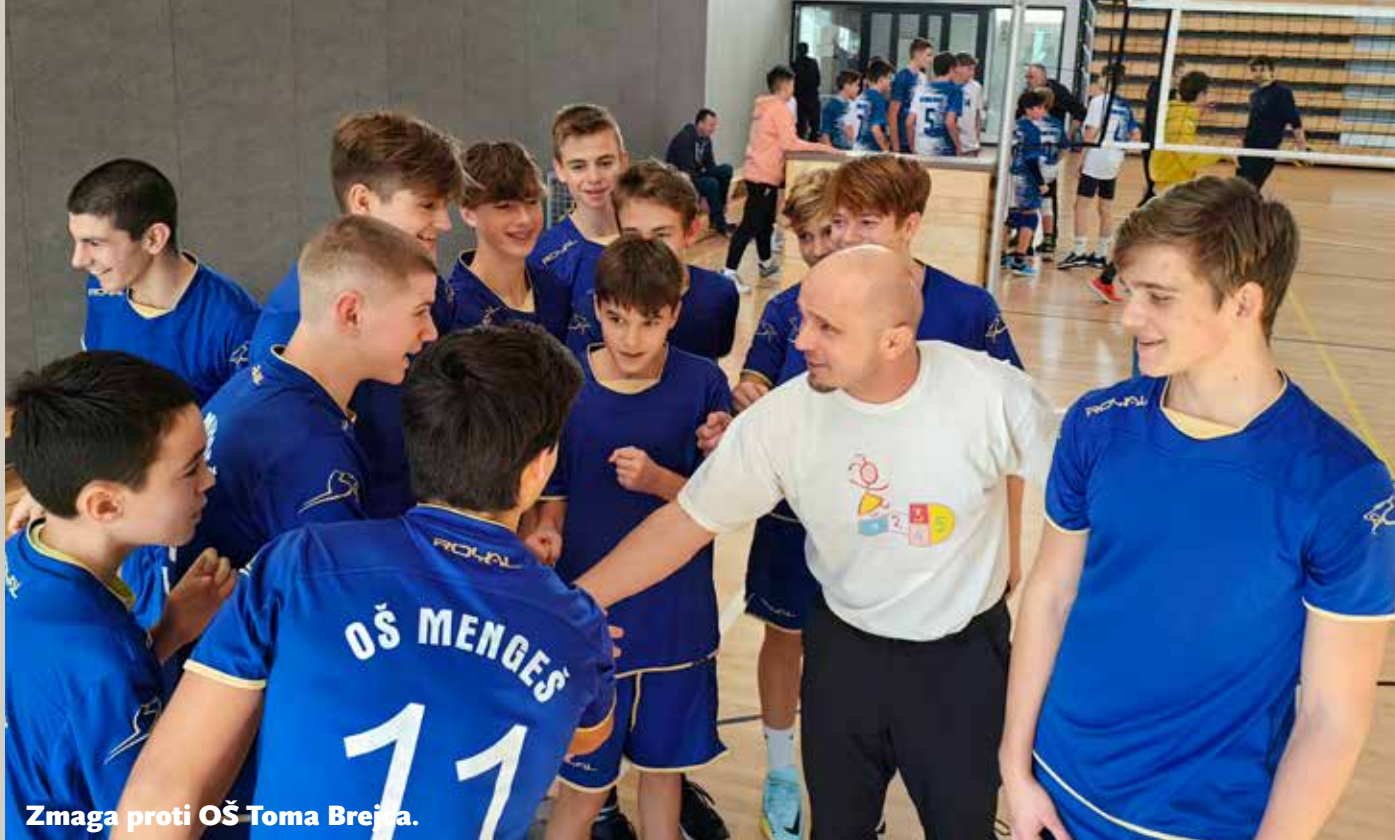
Zmaga proti OŠ Toma Brejca.

finale so se uvrstile štiri najboljše šole na regijskem nivoju (območje Domžal, Kamnika in Medvod): OŠ Rodica, OŠ Simona Janka, OŠ Toma Brejca in OŠ Mengeš. Na tekmi za tretje mesto sta se pomerili OŠ Rodica in OŠ Simona Jenka. Po izenačeni igri si je tretje mesto priigrala OŠ Simona Jenka.