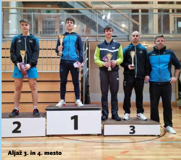
Aljaž 3. in 4. mesto