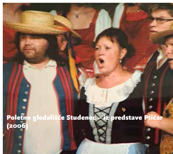
Poletno gledališče Studenec – iz predstave Ptičar (2006)