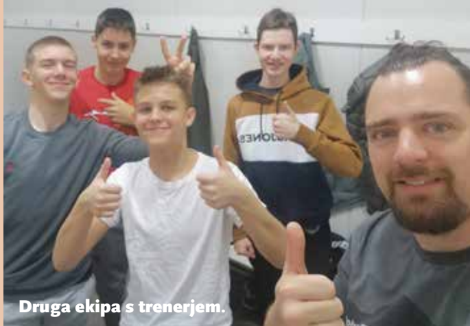
Druga ekipa s trenerjem.