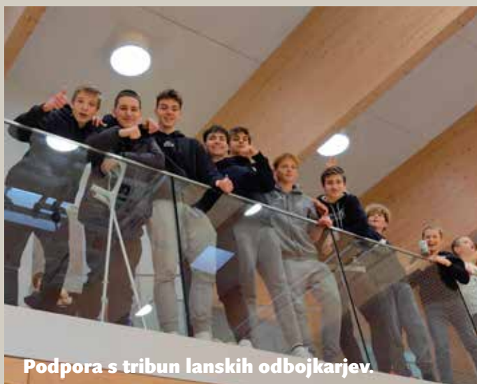
Podpora s tribun lanskih odbojkarjev.

Tudi na regijskem tekmovanju se nam je uspelo uvrstiti v finale, ki smo ga organizirali v Športni dvorani Mengeš. V