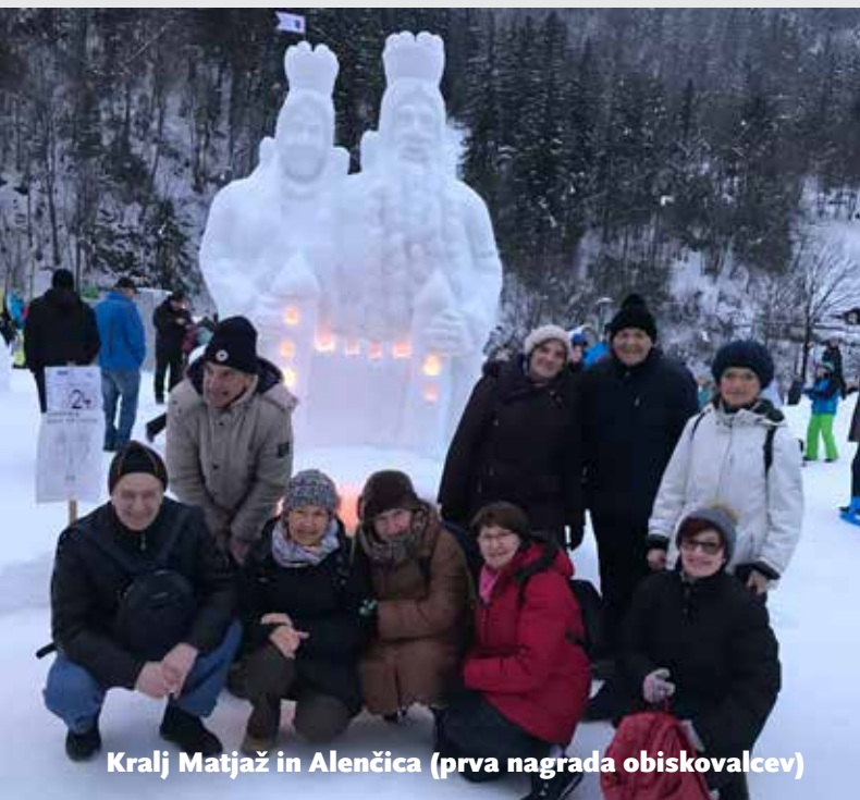
Kralj Matjaž in Alenčica (prva nagrada obiskovalcev)

Tudi v mrzlem januarju smo se mengeški upokojenci odpeljali na izlet in ni nam bilo žal. Tokrat smo se podali na Koroško.