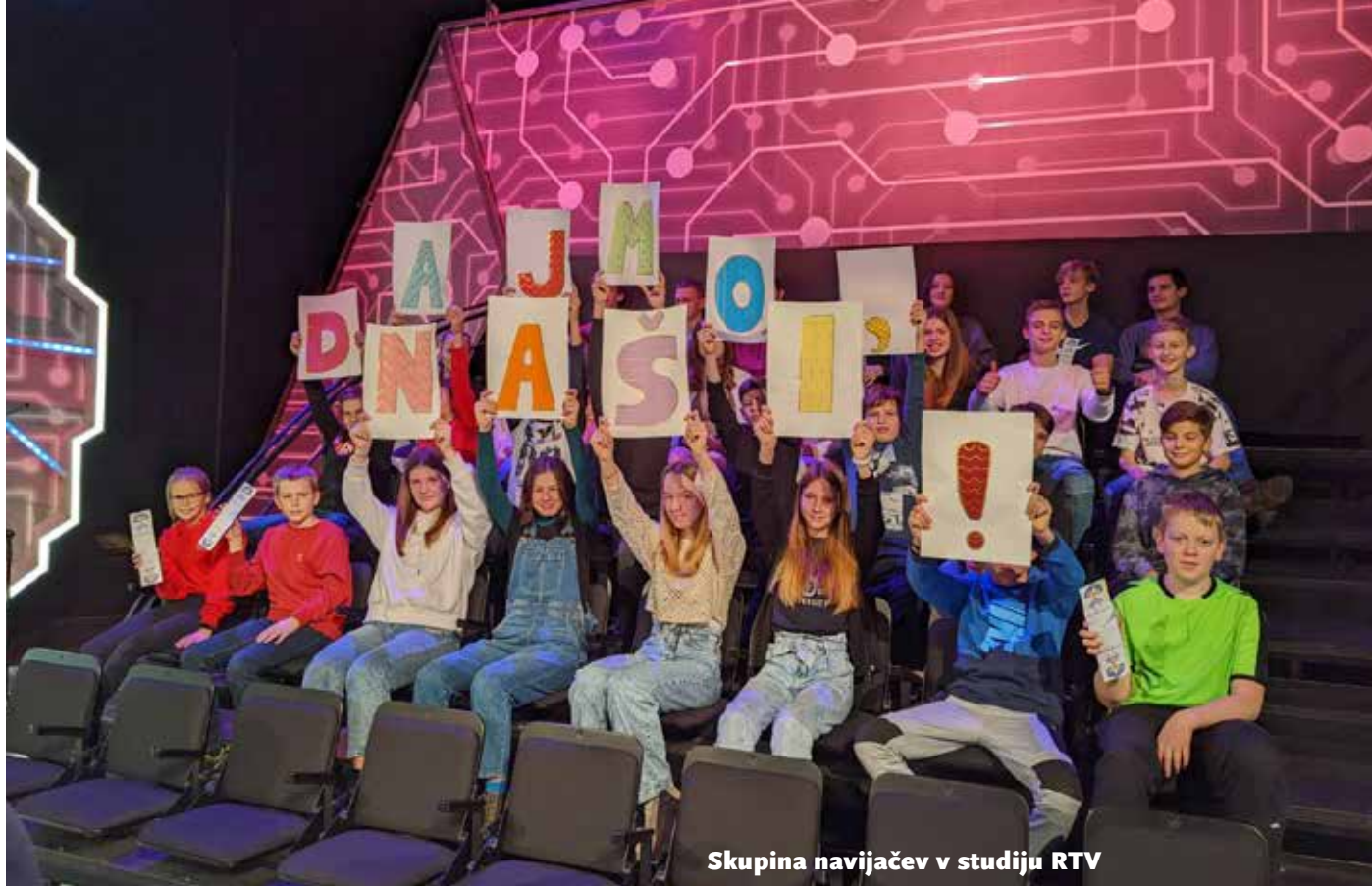
Skupina navijačev v studiju RTV