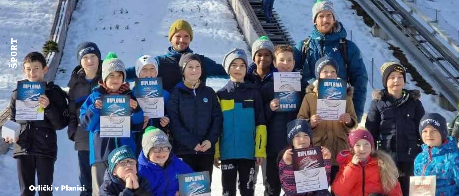
Orlički v Planici.