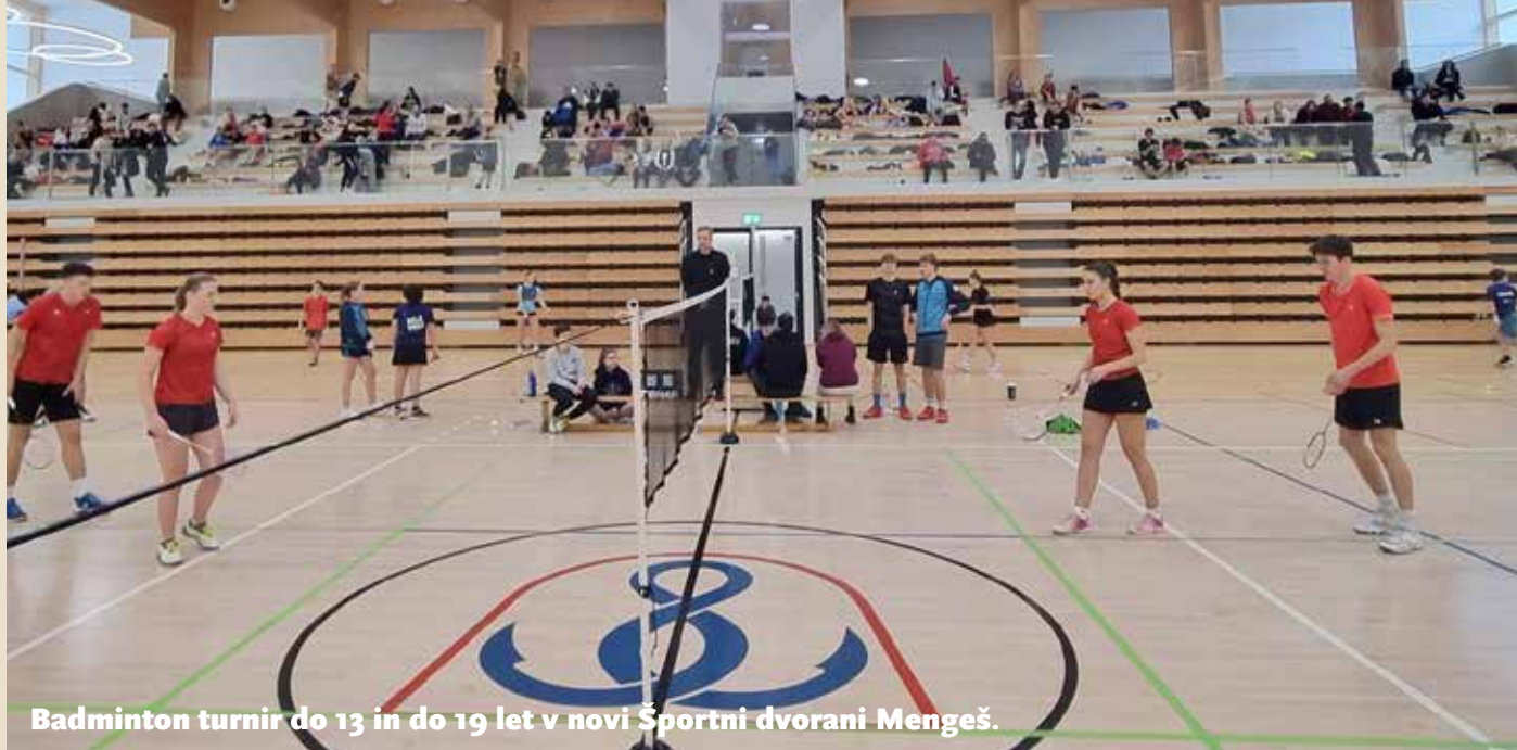
Badminton turnir do 13 in do 19 let v novi Športni dvorani Mengeš.