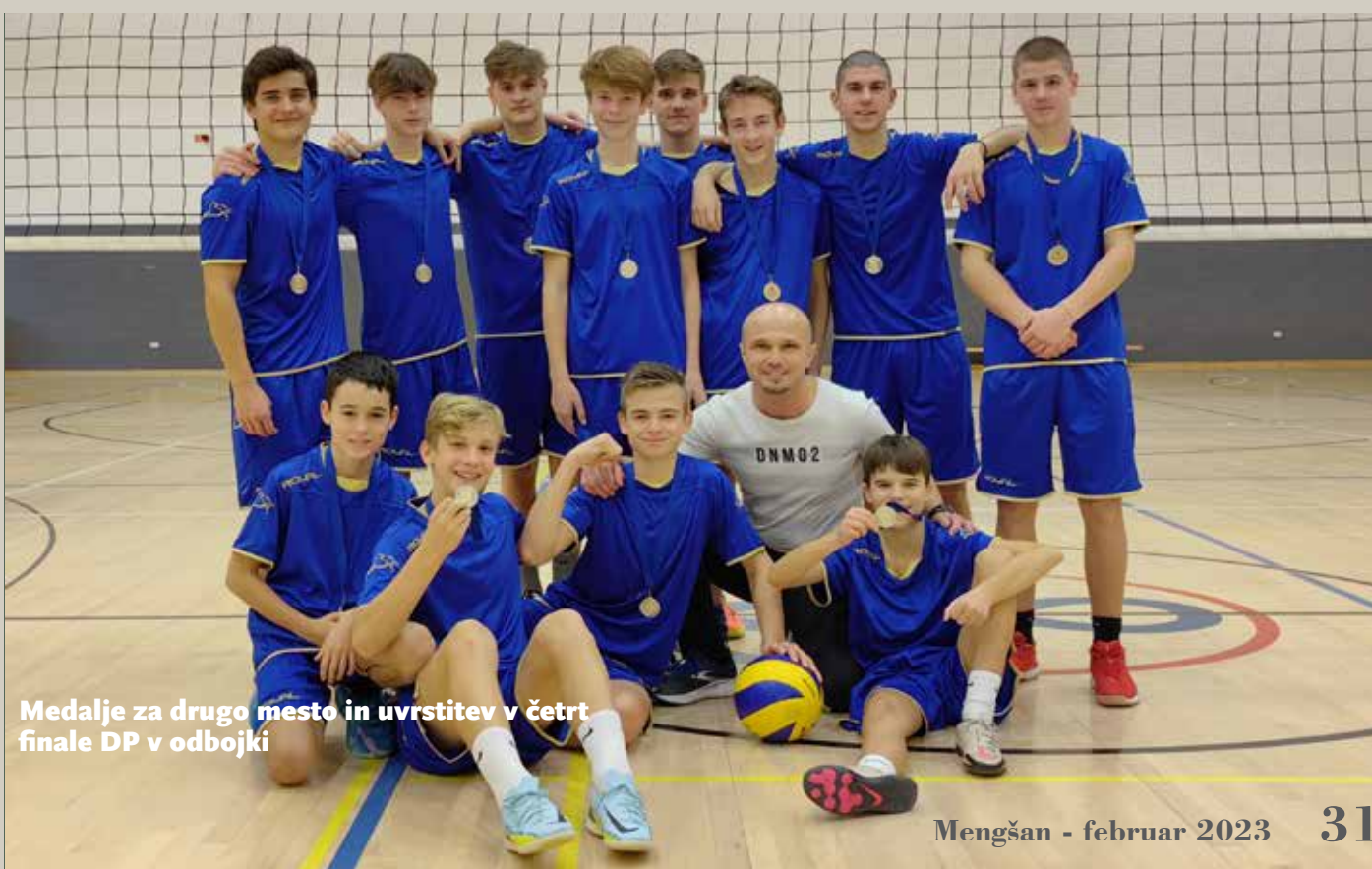
Medalje za drugo mesto in uvrstitev v četrtfinale DP v odbojki

Besedilo: Aleš Koštomaj , učitelj športne vzgoje na OŠ Mengeš • Foto: Samo Zelko