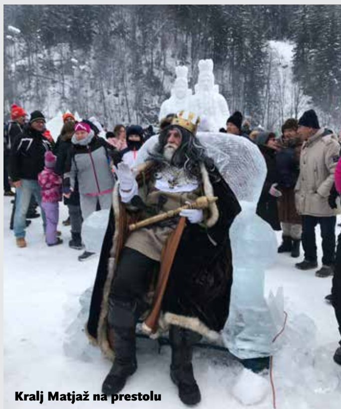
Kralj Matjaž na prestolu

Napočil je čas, da potešimo svojo lakoto. Odpeljali smo se v gostilno Brančurnik. V skrbno in lepo urejeni gostilni so poskrbeli za dobro hrano in rujno kapljico. Zadovoljni smo se odpeljali v Črno na Koroškem. Iz središča mesta smo se peš odpravili do nogometnega igrišča, kjer se je na velikem prostoru Matavževih travnikov zaključevala 31. tradicionalna