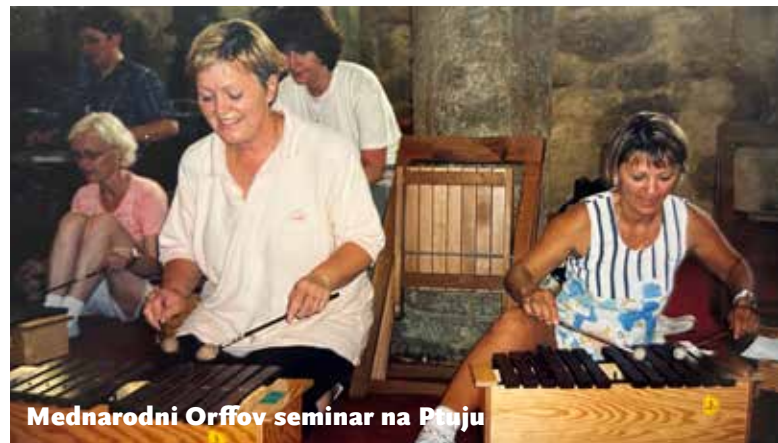
Mednarodni Orffov seminar na Ptuj