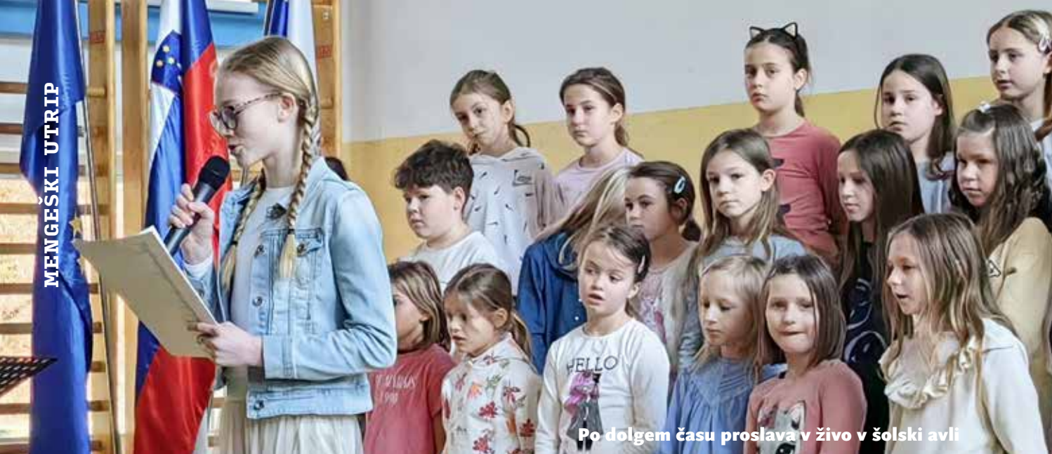
Po dolgem času proslava v živo v šolski avli