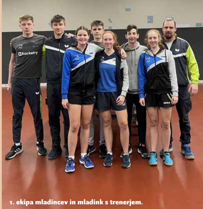
1. ekipa mladincev in mladink s trenerjem.