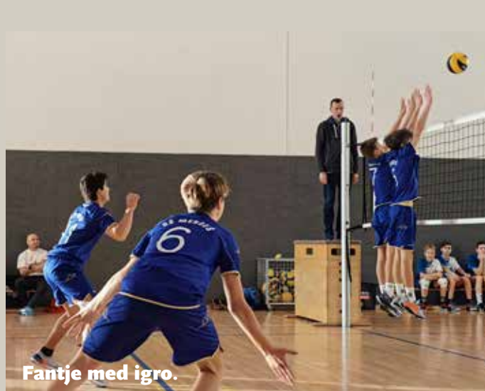
Fantje med igro.