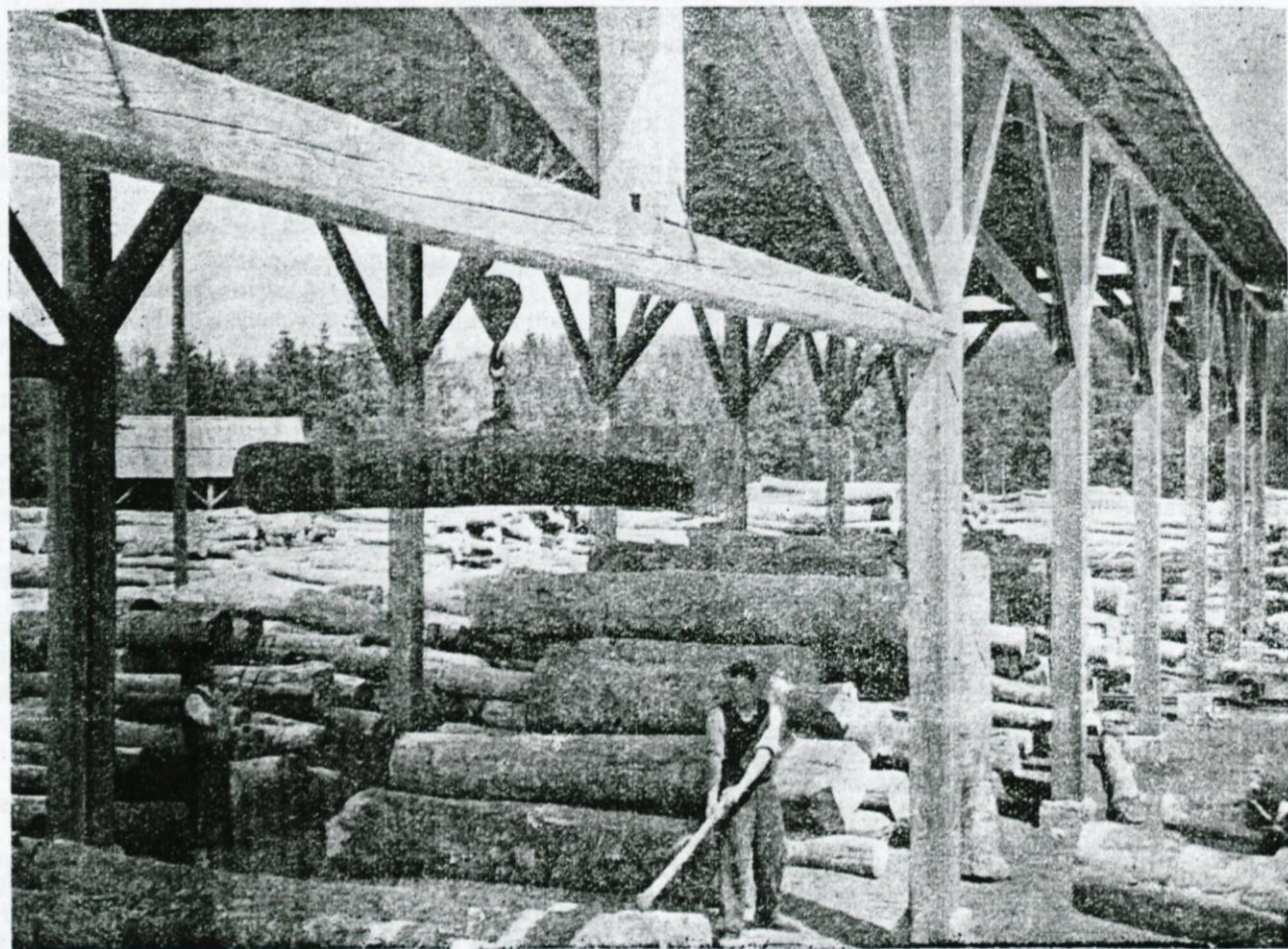
Mehanizacija je delavcu v pomoč

Izdaja Kombinat lesno predelovalne industrije Logatec — Odgovorni urednik Malus Branko — Letna naročnina 360— din — Tiskarna Umetniškega zavoda v Ljubljani