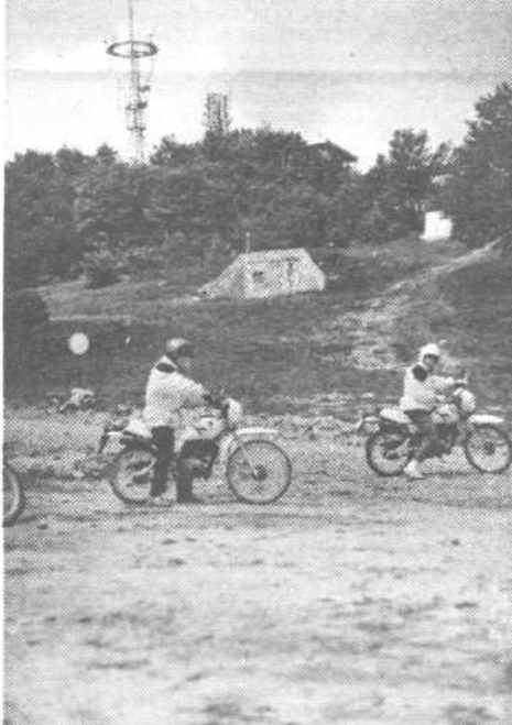
Z motorji z Barja na Krim