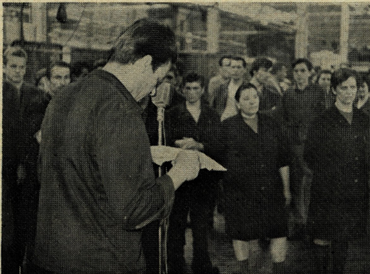
Zbor delovnih ljudi v predelovalnici kovin

Sektor ekonomsko tehničnih raziskav se mora potruditi za pravočasno izvršitev vseh nalog, ki so v zvezi z osvajanjem novih izdelkov. Tako bo takoj pristopil k uvedbi proizvodnje nekaterih novih izdelkov ter detajlno proučil program osvajanja za leto 1970 tako, da bo s tem seznanjeno vse osebje tega sektorja in bo brezpogojno vztrajal na realizaciji programa, saj so nekateri izdelki velikega pomena za podjetje in ni mogoče nikakor odlašati z začetkom njihove proizvodnje.