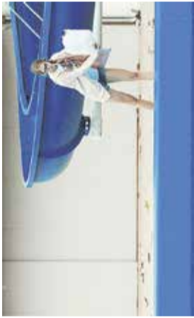
Film: Ne bom več luzerka