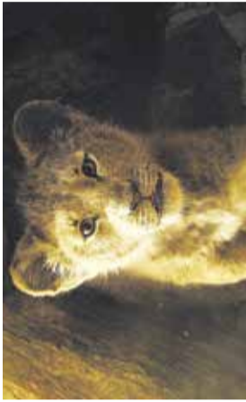
Film: Levi kralj

Razstava likovnih izdelkov bo na ogled od 2. do 15. julija.