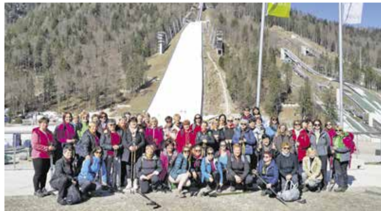
Krtke v Planici po prihodu iz Tamarja

Naslednje jutro smo se po ogrevalnih vajah odpravile do Belopeških je-