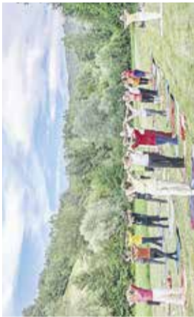
Vadba: Joga v parku

10.00–12.00 | ODKLOPI SE! Druženje ob družabnih igrah / za osnovnošolce / od 10.00 do 12.00 / vstop prost / org.: Knjižnica Domžale.