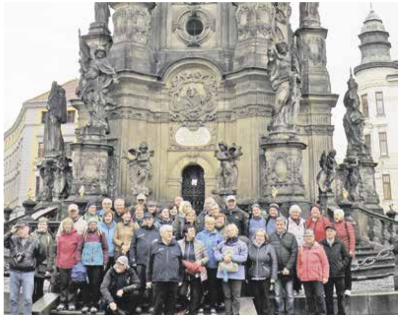
Upokojenci pred čudovitim znamenjem Sv. Trojice v Olomoucu

fascinantno katedralo, ki je pod zaščito Unesca. Večerja v bližnjem hotelu vključuje obvezne češke knedličke.