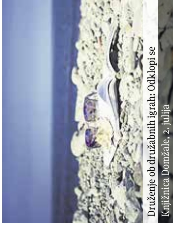
Druženje ob družabnih igrah: Odklopi se Knjižnica Domžale, 2. julija