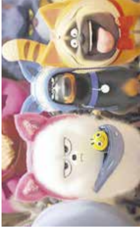
Film: Skrivno življenje hišnih ljubljencekov

* Dogodki, ki niso kulturne narave, so objavljeni samo v primeru, če prvih ni dovolj.