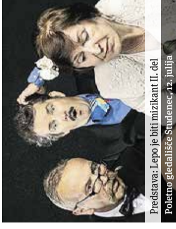
Predstava: Lepo je biti muzikant II. del Poletno gledališče Studenec, 12. julija