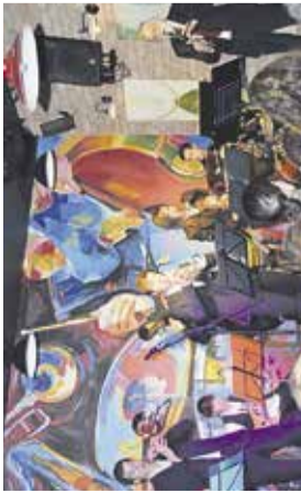
Koncert: Prijatelji dixielanda