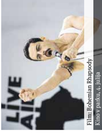
Film: Bohemian Rhapsody Kino v parku, 4. julija