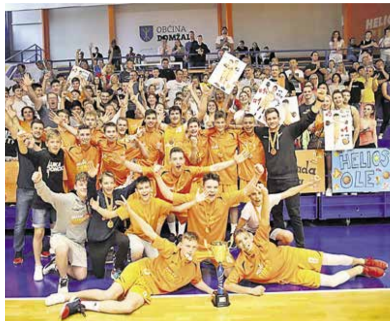
Mladi domžalski košarkarji še drugič zapored razred zase