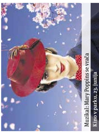
Muzikal: Mary Poppins se vrača Kino v parku, 23. junija