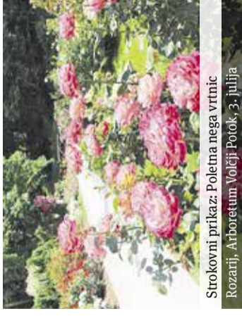
Strokovni prikaz: Poletna nega vrtnic Rozarij, Arboretum Volčji Potok, 3. julija