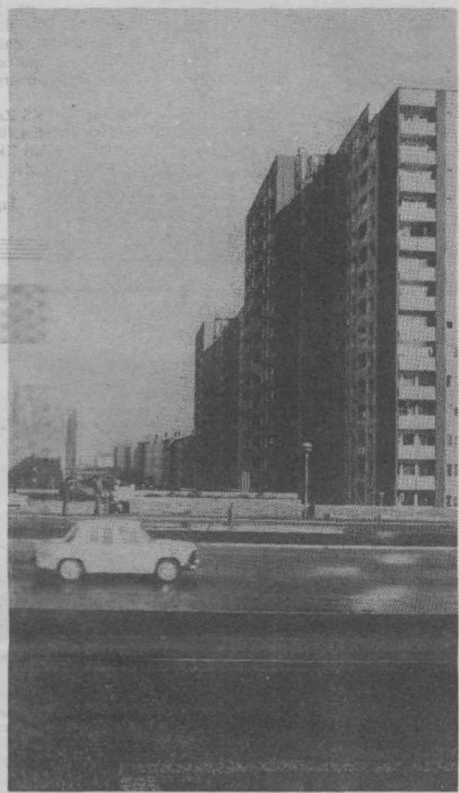
Naša KS je ena največjih v Sloveniji. Predlog o njeni samoupravni preobrazbi in razdelitvi je že v razpravi in že je slišati razne komentarje. O njih več kasneje.