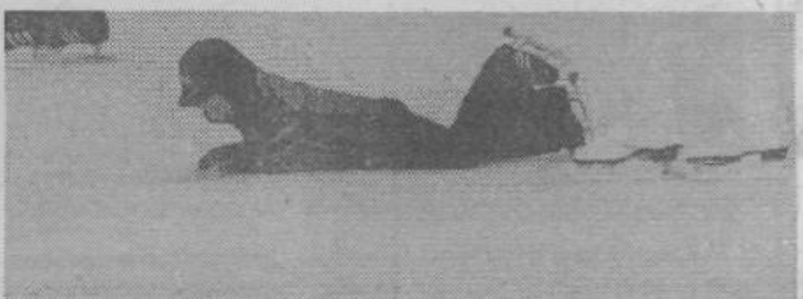
V varnih — nogah.

In koliko naj prehodimo dnevno? Toliko, kolikor nam dovoljuje telesna pripravljenost, da se dobro počutimo. Morda le nasvet: če ste stari nad 20 let in ste se odločili za enodnevni izlet, naj bi prehodili 20 do 30 km na ravnem terenu. Vaša hitrost naj bi bila med 4—4,5 km na uro, kar naj bi trajalo 5—8 ur. To seveda velja za tiste, ki se s hojo že ukvarjajo. Sicer pa velja, da bi si morali vsaj dvakrat na teden vzeti čas za daljši sprehod, ki naj bi trajal 1—2 uri. BREDA FERINCEK