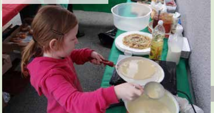
Mlada pomoč pri peki palačink