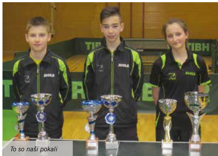
To so naši pokali