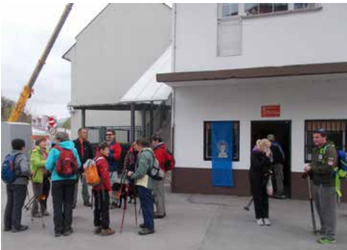
Start pred prostori PD Janez Trdina Mengeš

Prvo soboto po veliki noči, 22. aprila 2017, bo po naših planinskih poteh potekal tradicionalni, 31. Trim pohod Rašica, s startom med 7. in 9. uro, izpred prostorov Planinskega društva Janez Trdina Mengeš, na Slovenski cesti 28 (za občino v Mengšu oz. ob parkirišču za kulturnim domom).