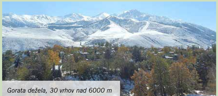
Gorata dežela, 30 vrhov nad 6000 m

V svojem letnem programu aktivnosti ima TD Dobeno med drugimi uvrščena tudi različna potopisna predavanja o tujih deželah, ki pritegnejo številne obiskovalce. Najbolj so obiskane potopisne reportaže o nam manj znanih, oddaljenih deželah. V četrtek, 23. marca 2017, je bila ob 18. uri v kmečkem turizmu Blaž organizirana še ena predstavitev nam malo poznane dežele.