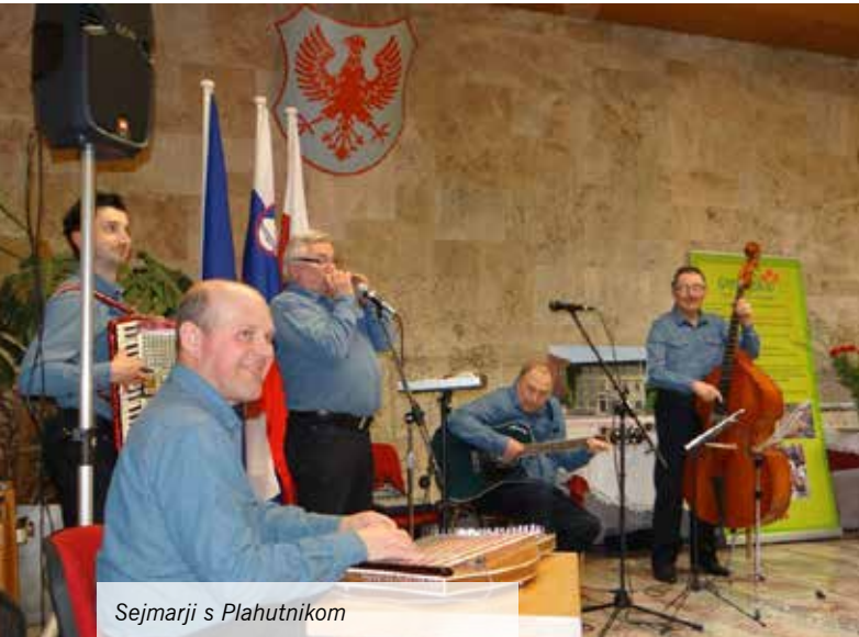
Sejmarji s Plahutnikom