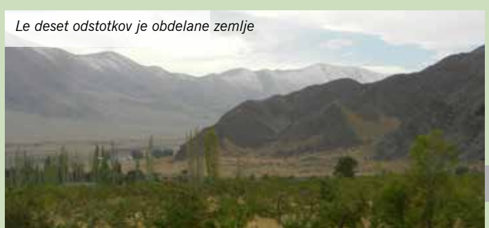
Le deset odstotkov je obdelane zemlje