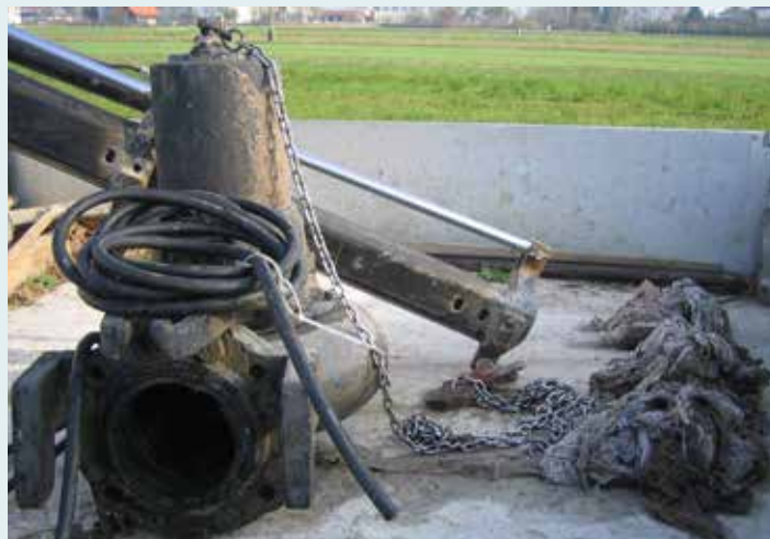
Krpe, vlažilni robčki in podobni odpadki, ki v vodi ne razpadejo, pogosto povzročijo okvaro črpalk

Pripomočki za osebno nego: vlažilni robčki, vatke, palčke za ušesa Pravilno je, da jih odlagamo v črne zabojnike. Če tovrstni odpadki