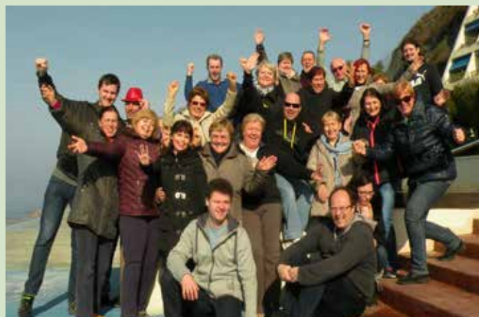
Med odmorom med intenzivnimi pevske vaji

Po čem si bomo zapomnili letošnje intenzivne pevske vaje? Prav gotovo po tem, da prvič v zadnjih 12 letih delovanja zbora nismo imeli novih pevcev, torej so intenzivne vaje minile brez veselja ob »krstu« novih članov zbora.