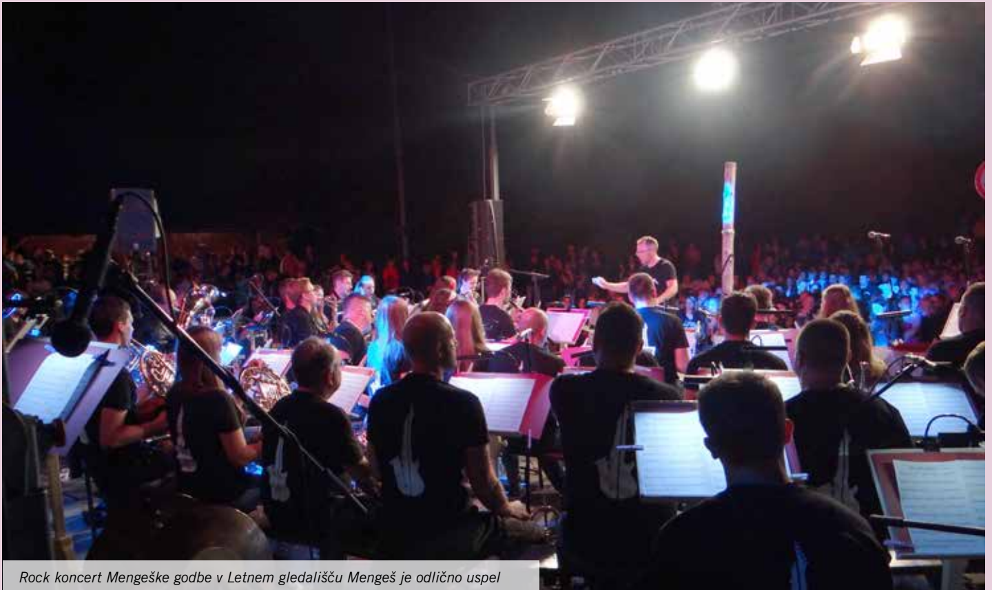
Rock koncert Mengeške godbe v Letnem gledališču Mengeš je odlično uspel