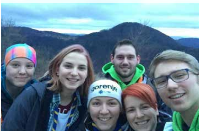
Ekipa RUP Mengeš na vrhu Svetega Primoža čaka sončni vzhod