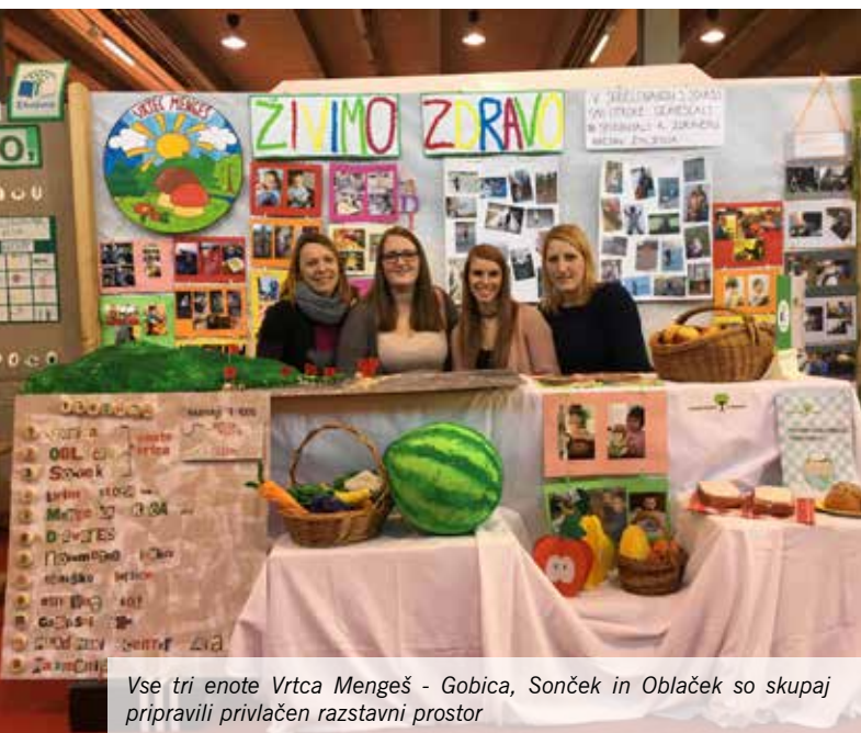
Vse tri enote Vrtca Mengeš - Gobica, Sonček in Oblaček so skupaj pripravili privlačen razstaveni prostor

Vrtec Mengeš je vključen v program Ekošole, ki je mednarodno uveljavljen program, namenjen usposabljanju in večanju ozaveščenosti glede odnosa do okolja, narave in bivanja nasploh. V Vrtcu Mengeš si prizadevamo, da naše delo z najmlajšimi temelji na celostnem pogledu na življenje, k varovanju zdravja, izgradnjo medsebojnih odnosov ter skrbi za okolje in naravo.