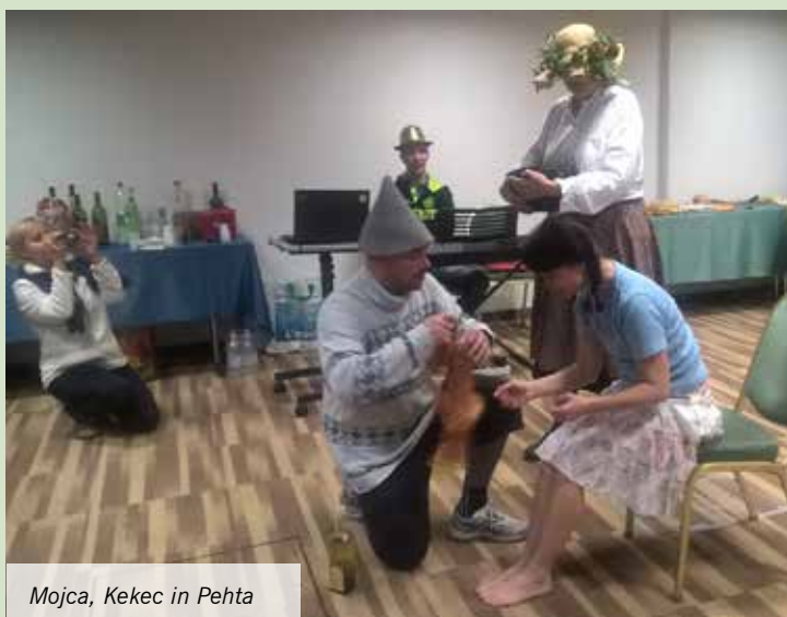
Mojca, Kekec in Pehta