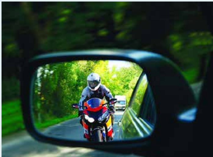
Vozniki vozil naj vozijo previdno, pri čemer naj bodo pozorni še posebej na motoriste

Pomladno sonce in ugodne temperature kar vabijo voznike enoslednih motornih vozil, da po dolgi zimi preizkusijo svoje »jeklene konjičke«. Pri tem policisti svetujemo, da bodite pri vožnji izjemno previdni, hitrost svoje vožnje pa prilagodite razmeram na cesti.