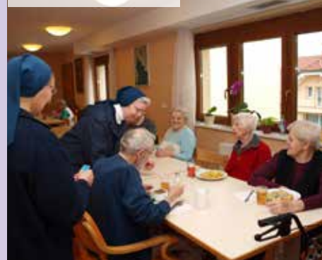
Iz Doma sv. Katarine

V Vincencijevem času se je pokazala potreba po osebah, ki bodo prijele za vsako delo pri bolnikih in ubogih. Po srečanju z Ludoviko de Marillac, ki je bila plemkinja po rodu, še bolj pa po srcu, je 29. novembra 1633 leta ustanovil Družbo hčera krščanske ljubezni, ki je prevzela skrb za bolnike. Korenine slovenske province segajo v sredino 19. stoletja, ko je bila ustanovljena Graška provinca Družbe hčera krščanske ljubezni. Iz Gradca so prve sestre prišle v Maribor že leta 1843, v Ljubljano pa 1852. Hčere krščanske ljubezni (HKL) sv. Vincencija Pavelskega – usmiljenke - v duhu karizme delujemo še danes. Želimo ljubiti Boga s služenjem bližnjim. V Domu sv. Katarine v Mengšu dajemo celotno oskrbo bolnim in ostarelim. Pomagamo tudi osamljenim, odrinjenim na rob družbe in ubogim. Posvečamo se duhovni revščini današnjega časa. Sestre delamo kot katehistinje po župnijah in smo vključene v župnijsko pastoralo. V provincialni hiši v Šentjakobu organiziramo duhovne vaje za mlade in odrasle ter tako oznanjamo Kristusa in njegovo ljubezen do vsakega človeka. Naša skrb so tudi družine z več otroki, katerim poskušamo pomagati preko ustanove Aninega sklada. Klic današnjega časa za pomoč prihaja tudi od razdrtih družin, ki potrebujejo moralno podporo, spremljanje in molitev.