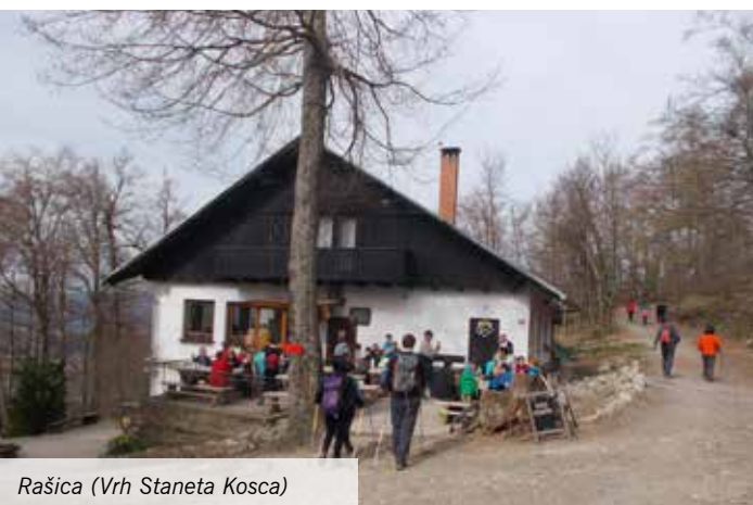
Rašica (Vrh Staneta Kosca)

Besedilo: Gregor Jeras, PD Janez Trdina Mengeš