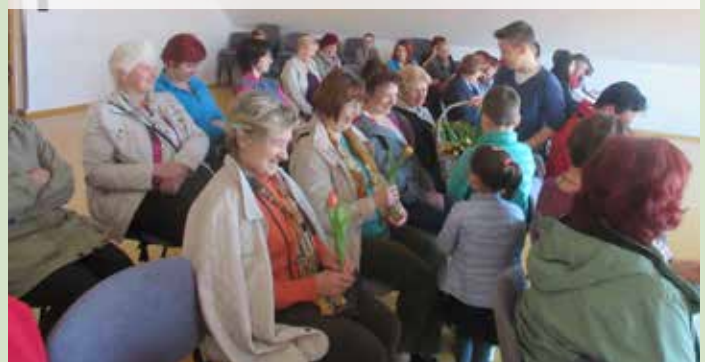
Nastopi so raznežili prav vse slavljenske v dvorani