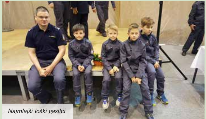
Najmlajši loški gasilci