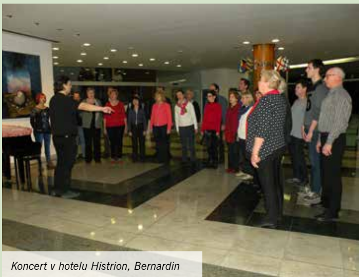
Koncert v hotelu Histrion, Bernardin

Že tradicionalno ima MePZ Svoboda Mengeš 6. januarja božični koncert v cerkvi Sv. Petra v Komendi. Koncert je bil še zadnji od treh božičnih koncertov, izvedenih v decembru 2016. Nežne božične in ostale pesmi so očarale številne poslušalce in veseli smo bili njihovega ploskanja.