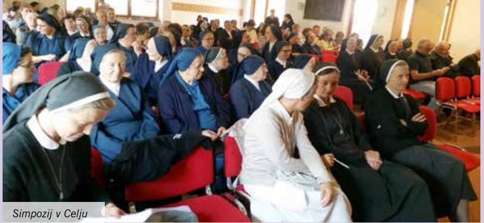
Simpozij v Celju

Poleg naštetih družb posvečenega življenja Vincencijev duh živijo tudi mladi in odrasli na različnih področjih. Marijanska vincencijanska mladina je laiško mednarodno cerkveno združenje mladih. V svojem okolju in v svojem vsakdanjem življenju se trudijo živeti po zgledu Device Marije in po zgledu svetega Vincencija Pavelskega. Prizadevajo si, da bi čim bolje živeli štiri Marijanske kreposti, ki jim jih je kot vodilo v našem krščanskem življenju zapustila Marija: ponižnost, iskanje Božje volje, dobrotelost in čistost. V župnijah, kjer so te skupine aktivne, se srečujejo na mesečnih srečanjih. Obiskujejo starejše,