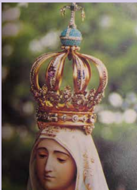
Fatimska Marija z originalno krono

Marija je fatimskim pastirčkom rekla, da je mir na svetu v njenih rokah in da se bo svet rešil vojn in izprosil mir samo s čaščenjem Njenega Brezmadežnega Srca in molitvijo rožnega venca. Z molitvijo rožnega venca in sprejemanjem žrtev lahko izprosimo tudi spreobrnjenje grešnikov in rešitev duš.