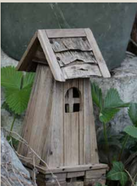
Zaskrbljujoče je tudi dejstvo, da je bilo ob osamosvojitvi več kot 100 okoljevarstvenih organizacij, danes pa jih ni več niti 10

Dnevno dobivam sporočila iz različnih koncev Slovenije zaradi degradacije okolja na lokalni