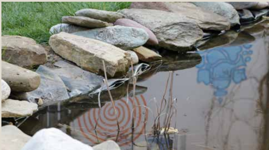
Slovenija je v vodnem stresu. To pomeni poplave in hkrati suše ter upad podtalnice

Pri nas v Sloveniji je zakonodaja napisana v prid kapitala. Imeli smo dobro okoljsko politiko in zakonodajo v prvem desetletju sa-