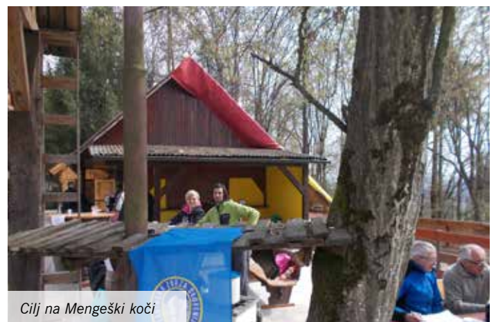
Cilj na Mengeški koči