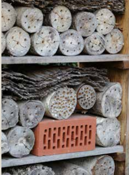
Naš planet je edini, ki ga imamo

Tudi mengeško-domžalsko območje zagotovo ni imuno na ekološke probleme. Kako vi dojemate ta severovzhodni del Ljubljanske kotline in na katere okoljske anomalije opozarjate?