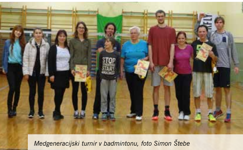
Medgeneracijski turnir v badmintonu

Zvit udarec. Žogica pada tik ob mreži. Se jo sploh splača loviti? Dvom o tem se hipoma razblini. Vse njegove moči se usmerijo v tek, ki se prelevi v skok s padcem. Parket zaječi in vzvalovi, kot bi želel izbruhniti. A žogico mu je le uspelo ujeti. Igra je rešena - vsaj do naslednje poteze.