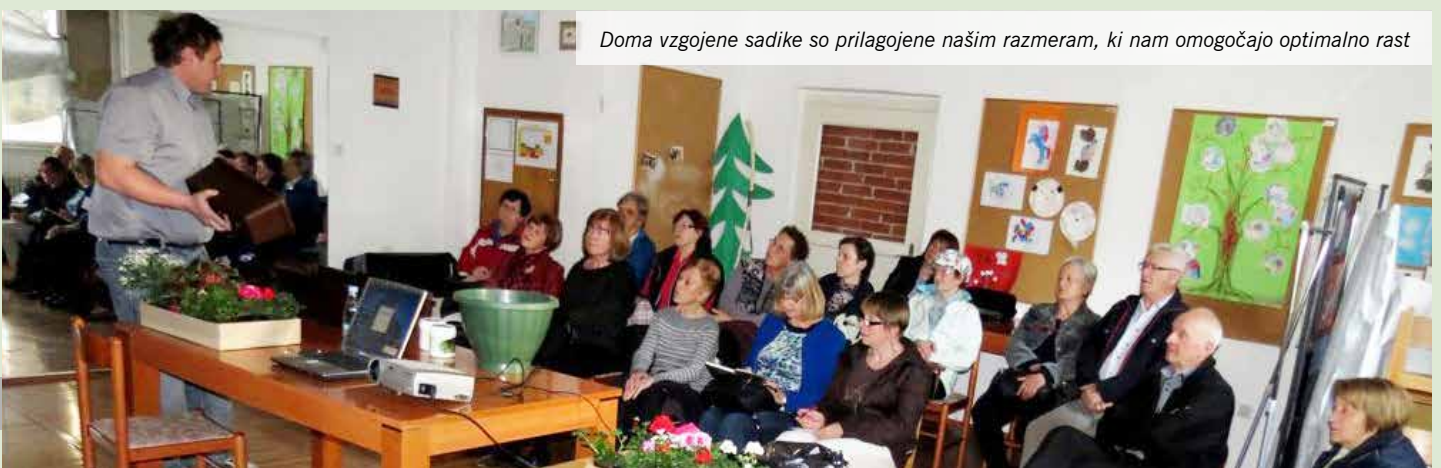
Doma vzgojene sadike so prilagojene našim razmeram, ki nam omogočajo optimalno rast