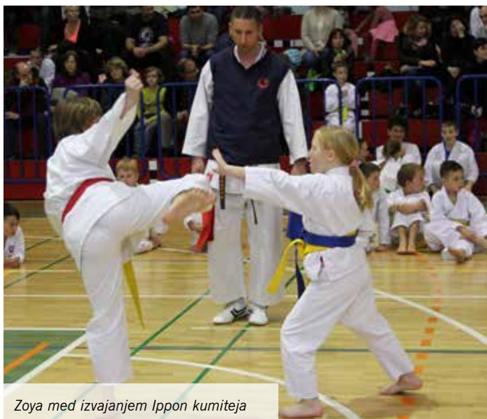
Zoya med izvajanjem Ippon kumiteja

Z začetkom malce toplejših dni tudi pri karateistih postaja vse bolj vroče – začela so se namreč številna tekmovanja. Mengšani so se že udeležili regijskega prvenstva skupaj s karate klubi Domžale, Radomlje in Rodica, ki je potekalo 18. marca 2017 v telovadnici OŠ Venclja Perka v Domžalah. Ta je bila kar hitro polna mladih karateistov in karateistk, na tribunah pa so si prostor poiskali številni navijači. Dečki so se vznemirjeno pripravljali na borbo, deklice so pilile še zadnje podrobnosti pri izvedbi kat, mlajši tekmovalci pa so še malce povadili Ippon kumite. Regijsko prvenstvo je namreč pomembno tudi zato, ker si tekmovalci s prvimi petimi mesti v vsaki kategoriji zagotovijo vstopnico na državni turnir.