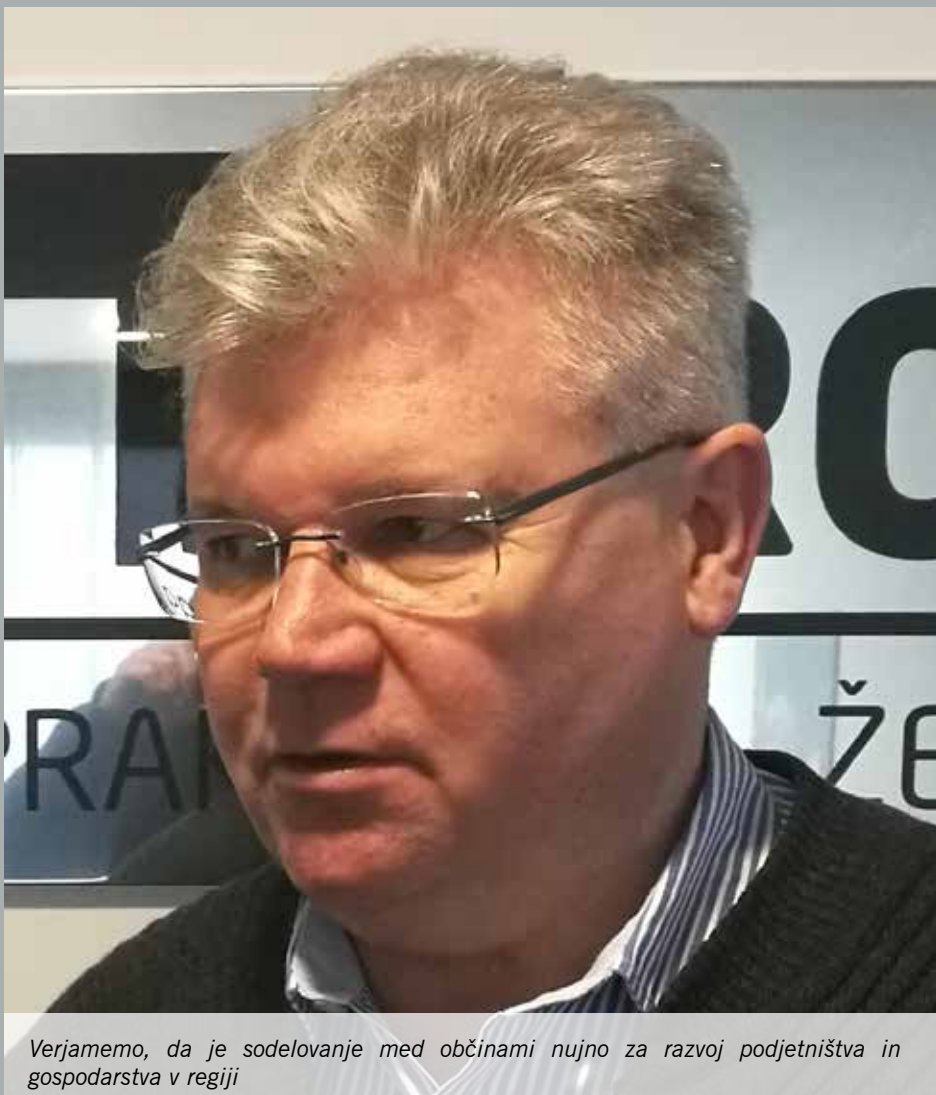
Verjamemo, da je sodelovanje med občinami nujno za razvoj podjetništva in gospodarstva v regiji

Veliko zadovoljstvo mi je kot očetu, ko vidim njihovo predanost in zavzetost. Naj povem, da so si sami želeli delati v domačem podjetju. Začeli so tako kot vsak vajenec pri osnovnih opravilih, se s svojim delom dokazali in pridobili spoštovanje ostalih so-