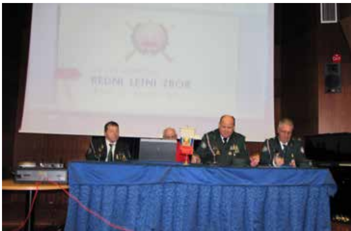
Poleg članov so se zbora udeležile še delegacije iz veteranskih združenj Ljubljana, Kočevje, Grosuplje in Ribnica ter OZČ Domžale