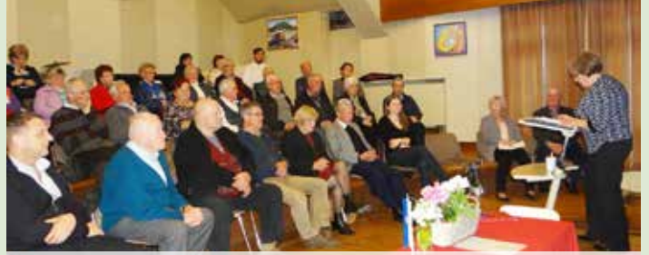
Občni zbor TD Mengeš - govor predsednice