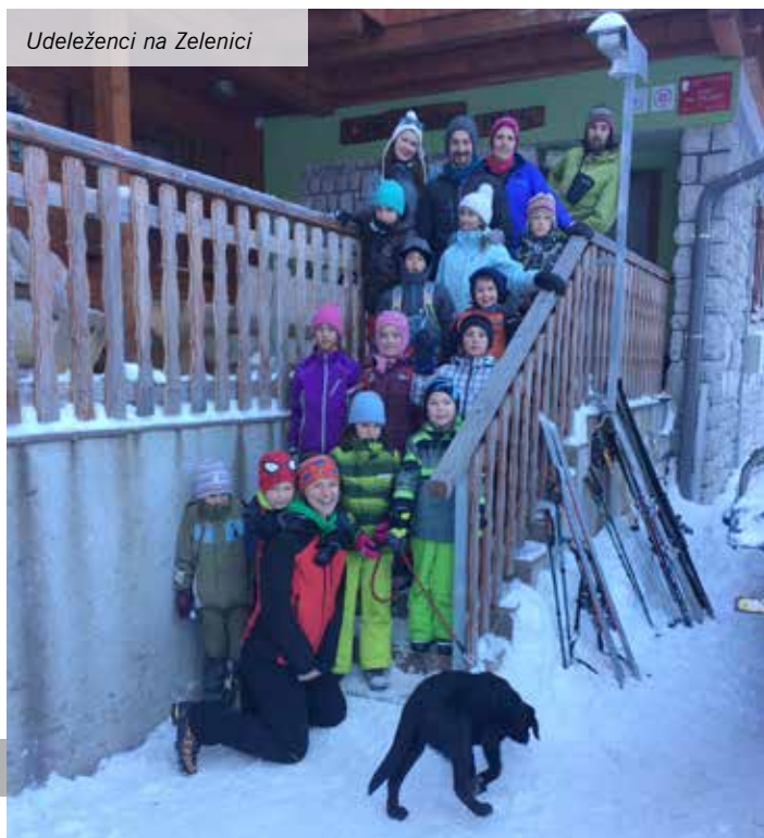
Udeleženci na Zelenici

Sončno sobotno dopoldne smo začeli s sprehodom do razgledne točke z vremensko postajo, po iskanju zasutega z žolno in snežnih vragolijah pa smo se v koči posladkali s čokoladnimi palačinkami. Konec dneva smo začinili s sankanjem, kvizom, hitrostnim rezanjem čokolade v XXL zimskih oblačilih in z zahvalo oskrbnikom Planinskega doma na Zelenici.