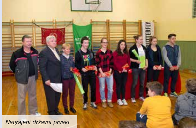
Nagrajeni državni prvaki