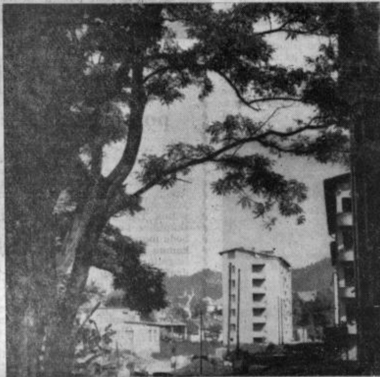
Motiv iz Celja

V razpravi, ki je pretežno obravnavala materialne razmere šolstva v žalski občini, je bilo poudarjeno, da je šolstvo sestavni del družbene stvarnosti, zaradi česar mu bo treba v fazi, ko se osamosvaja, posvetiti širšo skrb. To pomeni, da bi se morali vsi naporji za njegovo vsebinsko presnovo zlititi s celotnim prizadevanjem komune. Ker imamo opraviti z občutljivim procesom, kakršnega so preživljale gospodarske organizacije, bi mu uregnili vsaka prenapeta kritika le škoditi, narobe pa bi mu lahko zelo koristili, če bi ga bolj kot doslej podpirali v tem smislu, da bi prosvetne delavce družbeno angažirali. Žalski plenum je v teh pogledih prvo veliko znamenje. dhr