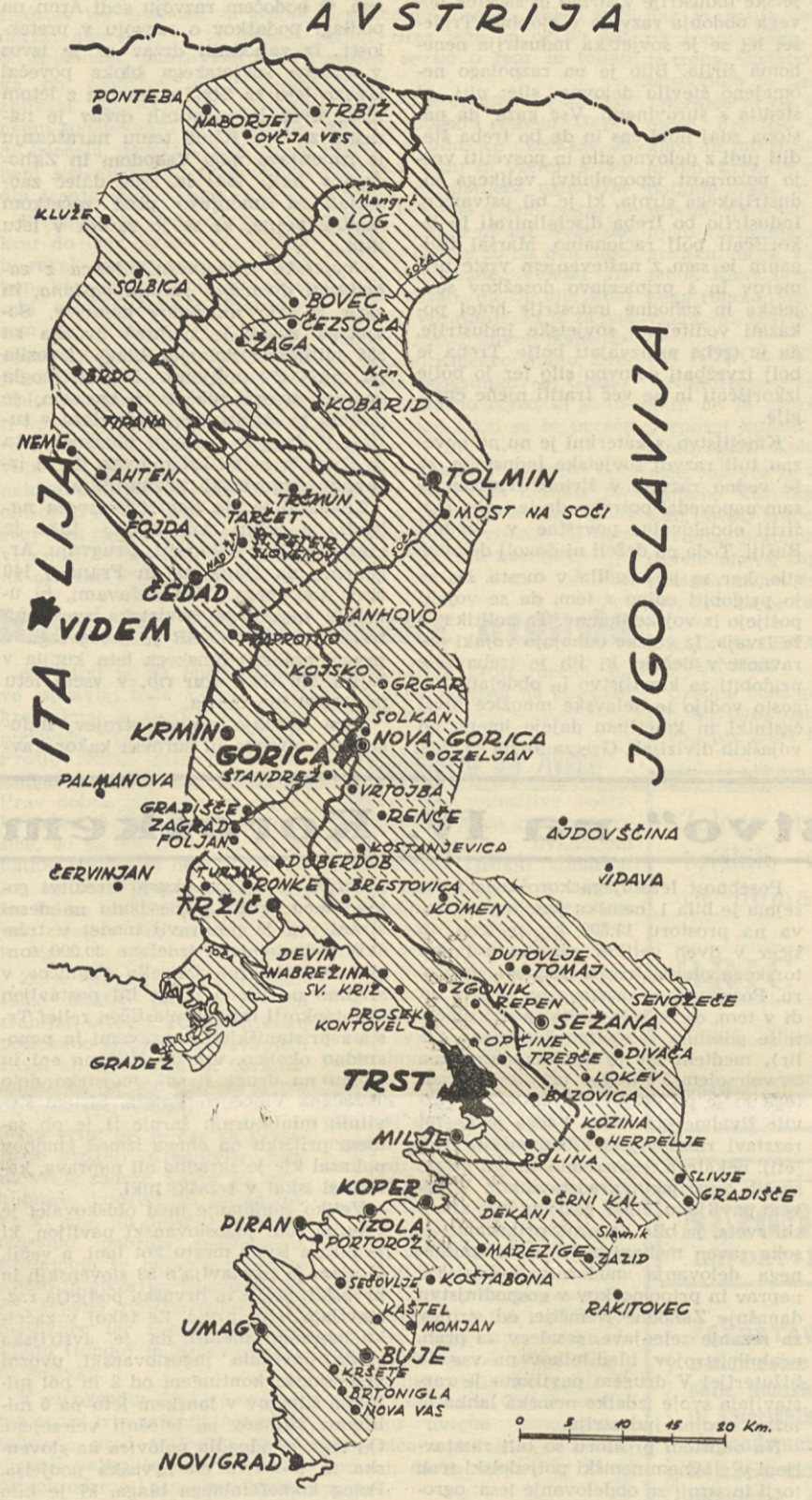
Na zemljevidu je začrtan obmejni pas, v katerem bo dovoljen obmejni promet v smislu videmskega sporazuma

Sporazum predvideva več vrst potnikov čez mejo in vsaki vrsti daje posebno pravice glede prenosa blaga, in sicer kmetom, delavcem in uradnikom. Posebno so določile glede prenosa valute. Blago se lahko uvaža oziroma izvaža brez carine, vendar carinski uradnik zabeleži v propustnici, ki bo imela 32 strani, količino blaga, ki je bilo uvo-