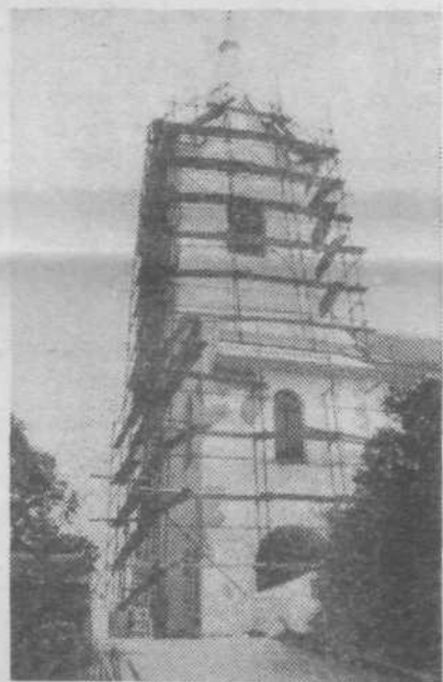
Obnova zvonika in strehe cerkve svete Marjete na Prežganju

Farani prežganjske župnije pa so se lotili urejanja zvonika cerkve svete