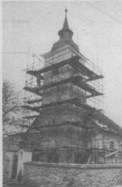
Obnova cerkvice svetega Urha v Zavogljem

LJUBLJANSKI REGIONALNI ZAVOD ZA VARSTVO NARAVNE IN KULTURNE DEDIŠČINE