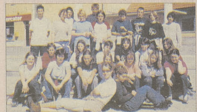
Udeleženci letošnjega tabora mladih raziskovalcev.