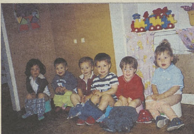
Časa za klepet je dovolj.