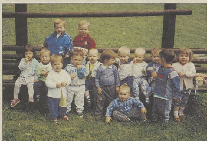
Na igrišču nam je vedno lepo.

Naš sponzor Štefan Pepelnak bo okviril risbici dveh 4-letnih deklic iz trebanjskega vrtca: Anja je narisala deklico na morju, Klavdija pa sebe, zato se lahko starši oglasijo pri g. Pepelnaku na Obrtniški 39 (nasproti Africe) v Trebnjem ali ga prej pokličejo na GSM 041 725948 .