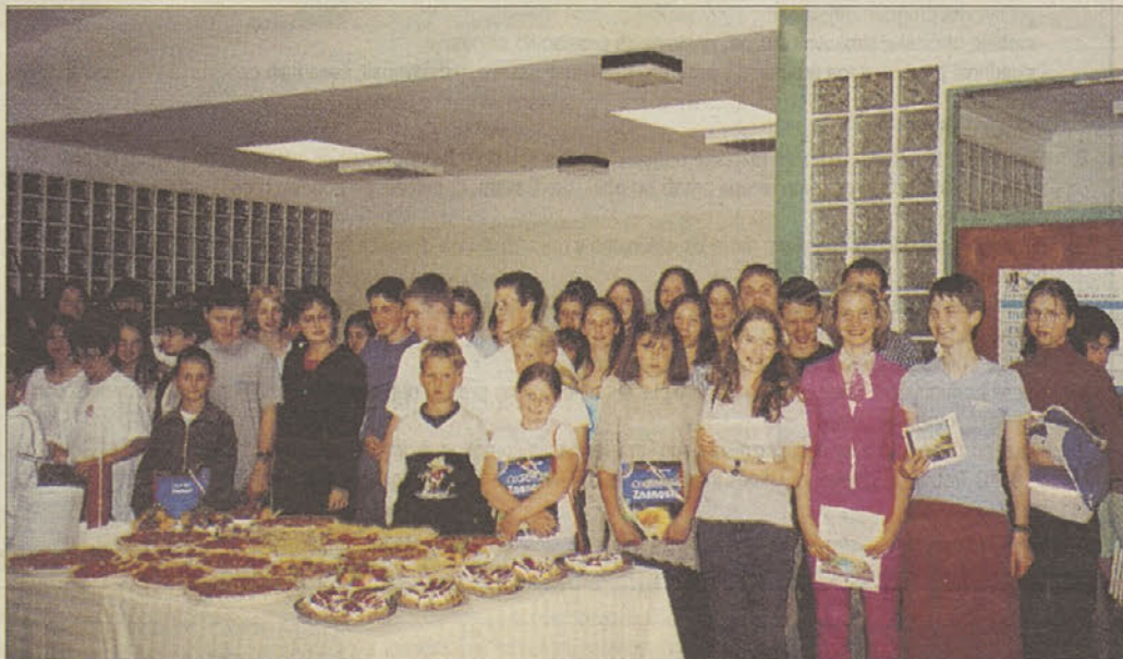
Najuspešnejši osnovnošolci trebnjske občine in učenci GŠ Trebnje na srečanju pri županu - (Več na 2. strani)