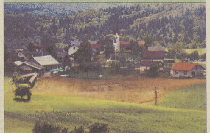
Pogled na Knežjo vas (Več na 3. strani)