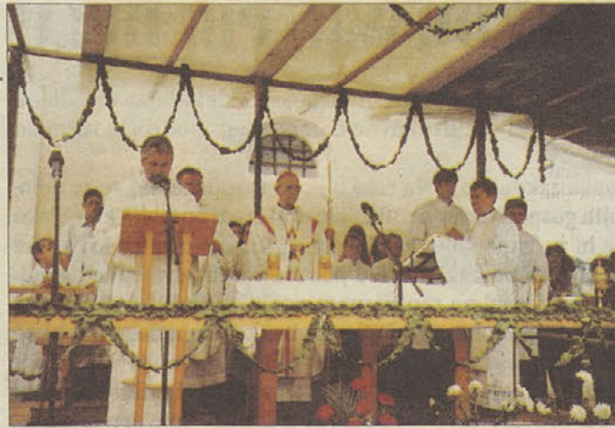
Maša v Knežji vasi

Ob tem bi se rad zahvalil vsem krajanom za izkazano zaupanje in pomoč, kajti brez njih ne bi bilo nič narejenega. Prav tako gre moja zahvala tudi Občini Trebnje, g. Cirilu Metodu Pungartniku in ostalim uslužbenecem Občine Trebnje, posebej g. Veleviču, za sodelovanje, nasvete in vso finančno pomoč in upam, da bomo tudi naprej še tako sodelovali kot doslej."