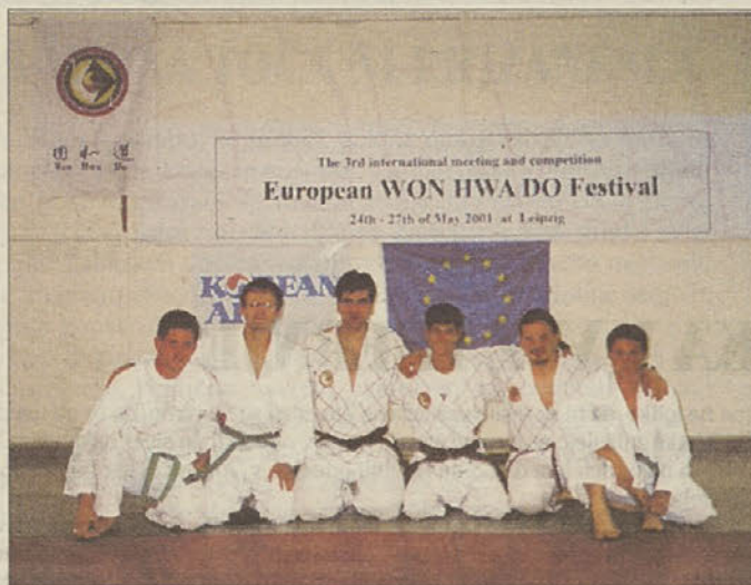
Predstavniki Slovenije in Master Chi