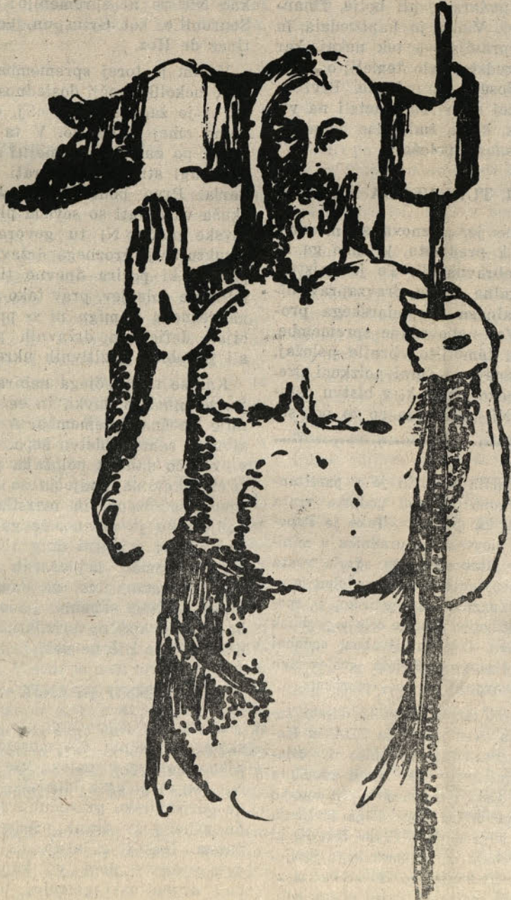
Ivan Bukovec: VSTALI KRISTUS

(s prisrčnimi voščili za veselo, blagoslovljeno Veliko noč.)